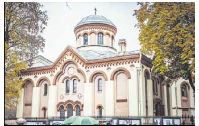
Pamaldų Paraskevės cerkvėje ukrainiečių bendruomenei tvarkaraštis www.facebook.com/ukrparaskeva

visose jose yra ukrainiečių. Lietuvos Stačiatikių Bažnyčia skiria daug dėmesio pabėgėliams, stengdamasi teikti jiems visokeriopą pagalbą - tiek dvasinę, tiek socialinę.