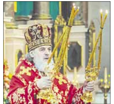
Metropolitino Inokentijaus Velykinis sveikinimas

Šventųjų Vilniaus kankinių religinė vienuolyno katedroje tą dieną bus atidengta, ir tikintieji galės tiesiogiai pagerbti relikvijas pagarbiai jas pabučiuodami. Pasibaigus Liturgijai bus dalijamos mažos ikonos praėjusių iškilmių ir religinės procesijos atminimui. Be to, visų procesijos dalyvių lauks vaišės.