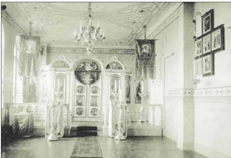
► Šv. Mikalojaus šventovės interjeras.

Visos ikonostaso ikonos - vadinamojo akademinio stiliaus, kuris buvo populiarus XIX a. Tačiau jų ikonografija ir pats ikonų išdėstymas atitinka griežtą, dar senovę susiklosčiusią sistemą.