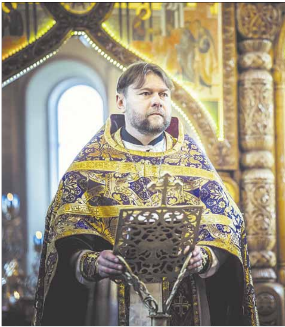
► Šv. Paraskevės parapijoje tarnauja ukrainietis, kanoninės Ukrainos Stačiatikių Bažnyčios kunigas.

Tėvas Andriejus pažymi: „Į mūsų pamaldas, žinoma, kviečiame ne tik ukrainiečiai, bet ir visi kiti norintys jose dalyvauti. Tačiau pirmiausia mes siekiame, kad mūsų tautiečiai ukrainiečiai turėtų visa, kas būtina, ir jie galėtų melstis taip, kaip yra pratę tai daryti savo tėvynėje“.