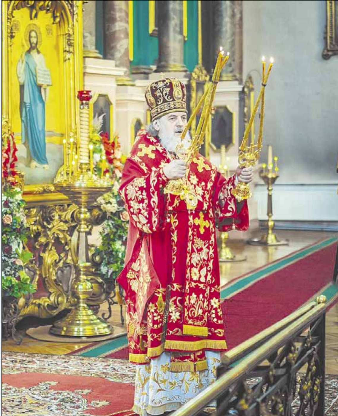
► Vilniaus ir Lietuvos metropolitas: „Velykų džiugesys gyvuoja mumyse tik tiek, kiek esame pasirengę dalytis juo su tais, kurie yra šalia“.

Taigi, broliai ir seserys, kur mūsų tikėjimas? Ar mes vadovaujamės juo savo gyvenime? Kokią