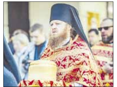
Vienuolyno brolių Velykiniai sveikinimai