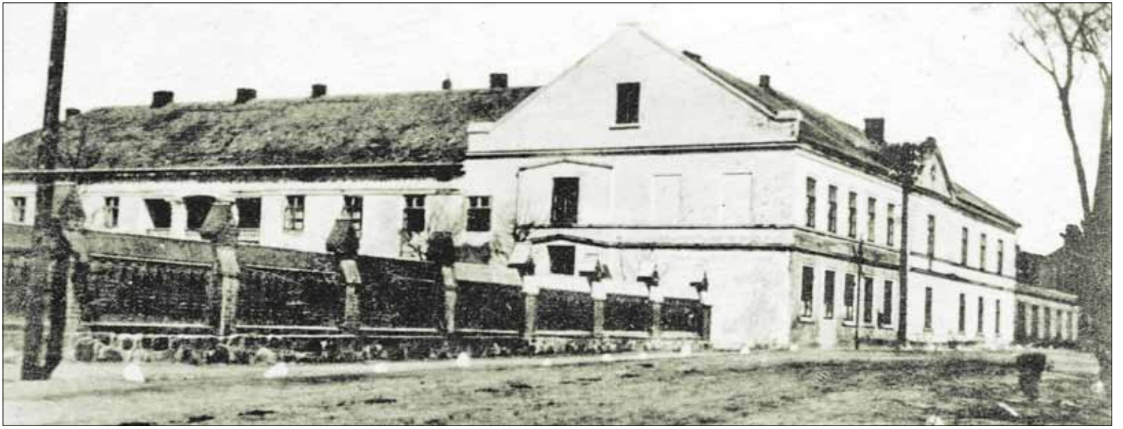
► Palanga. Gimnazijos pastatas. 1924 m. nuotrauka.

Šventovę įkurta antrame aukšte, erdvioje salėje. Visas jos įrengimo išlaidas padengė progimnazija. O tolesnei paramai teikti buvo įkurta naujosios šventovės Palangoje bažnytinė Globa.