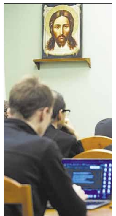
kupo Ambrosijaus straipsnį apie ganytojo tarnystę bei stojančiųjų į kursus atsakymus.

Šio laikraščio 6 psl. skaitykite Teologijos kursų vadovo, Trakų vys-