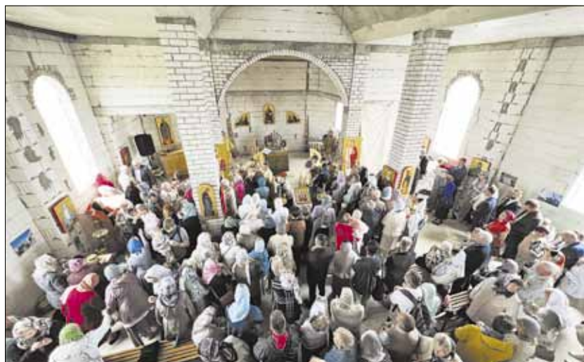
► Statoma šventovė pirmą sykį prigužėjo tikinčiųjų. Pamaldose dalyvavo svečiai iš aplinkinių parapijų.