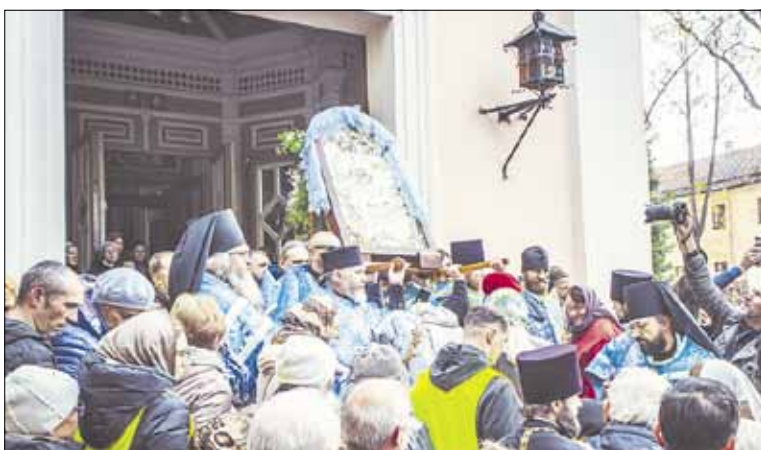
► Pernai, nešant Surdegio Dievo Motinos ikoną, religinėje procesijoje dalyvavo tūkstančiai žmonių.

Pasibaigus religinei procesijai, jos dalyvių lauks karšta arbata ir