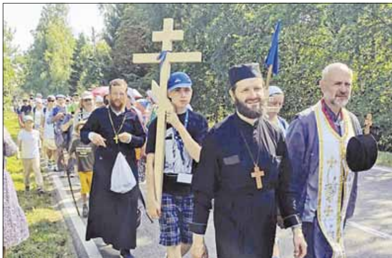
► Religinėje procesijoje į šventąjį Grabarkos kalną dalyvavo pilgrimai iš Lietuvos.

Rugpjūčio 19, švenčiant Viešpaties Atsimainymą, piligrimystę vainikavo iškilminga Dieviškoji Liturgija ant Grabarkos kalno, ku-