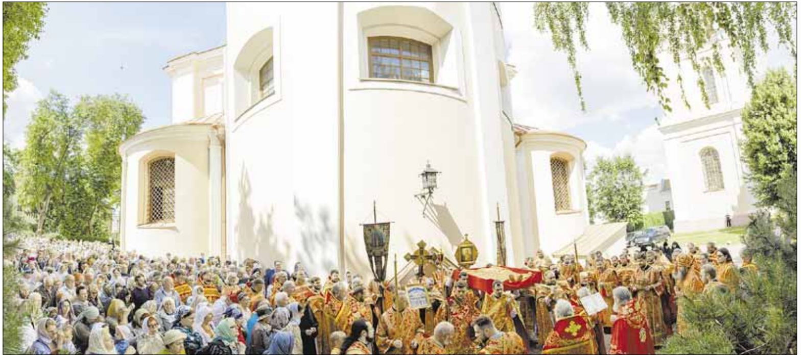
► Visų Lietuvos šventųjų pagerbimo dieną, gausiai dalyvaujant tikintiesiems, vyko religinė procesija, kurios metu šventųjų Vilniaus kankinių relikvijos buvo nešamos aplink vienuolyno katedrą.

Iškilmėse dalyvavo visi Lietuvos Stačiatikių Bažnyčios dvasininkai ir pasauliečiai, atvykę iš daugelio mūsų šalies stačiatikių parapijų.