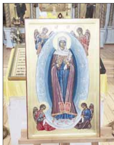
► Naujoji ikona, Atone nutapyta Šiaulių šventovei.

Rugpjūčio 13 Šiauliuose, Petro ir Pauliaus šventovėje, pasibaigus Dieviškajai Liturgijai, pirmą sykį priešais Dievo Motinos ikoną „Laiminančioji“ vyko intencinės pamaldos (su akatistu). Ši ikona į Šiaulių cerkvę buvo atgabenta iš šventojo Atono kalno.