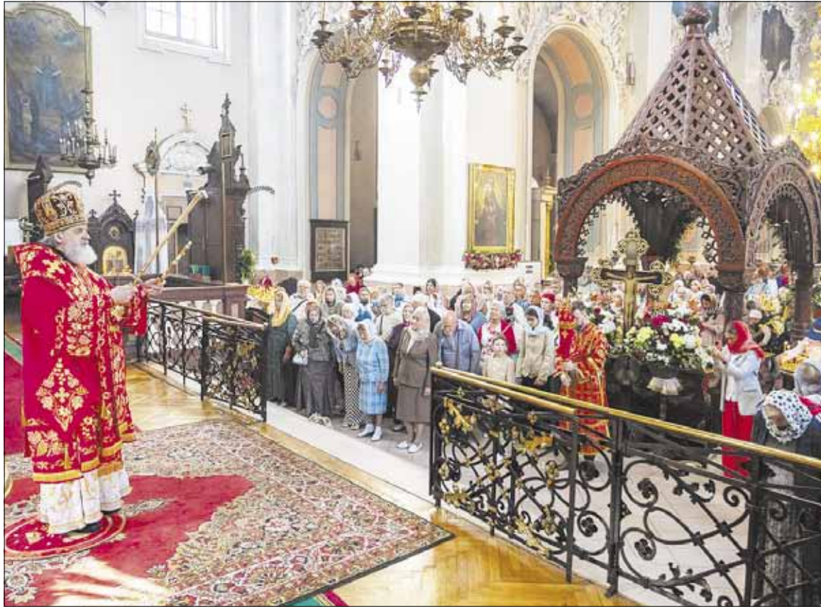
► Pastaruoju metu pagausėjo parapijiečių Lietuvos Stačiatikių Bažnyčios šventovėse. Iš dalies tai įvyko pabėgėlių iš Ukrainos dėka.

Baigiantis balandžiui, šventųjų Vilniaus kankinių atminimo dieną, vyko didelė, gausi religinė procesija, skirta Bažnyčios vienybei. Procesijoje dalyvavo visi Lietuvos Stačiatikių Bažnyčios dvasininkai ir apie tris tūkstančius pasauliečių (dalis jų atvyko į sostinę iš įvairių Lietuvos kampelių). Taip tikintieji parodė savo vieny-