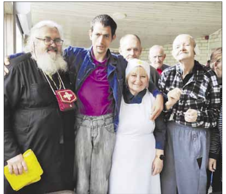
► Šv. vienuolės Charitinos Lietuvaitės Seserija gailestingumo darbus gausina jau devintus metus.