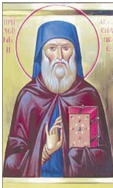
► Šv. vienuolio Leontijaus (Karpovičiaus) ikona.

ontijus buvo ne tik kvočiamas, bet ir žiauriai kankinamas, tačiau ir tai neprivertė išsižadėti Stačiatikybės, todėl jis buvo sukaustytas ir įmestas į „duobę“. Brolija pateikė skundą Tribunolui, siekdama išlaisvinti archimandritą. Tačiau maždaug metus šio skundo niekas nesvarstė, o po to Tribunolas nutarė perduoti Karpovičiaus bylą svarstyti „seimo nuožiūra“. „Dvokiančio kalėjimo“ požemių „tamsybėse“ šventasis Leontijus išbuvo dvejus metus. Atgavęs laivę jis tęsė ganytojo, pamokslininko, vienuolyno vadovo veiklą, vėl rūpinosi spaustuovės darbu, pats vertė ir rinko leidinius, kuriuos reikėjo spausdinti, kad vienuolyne vyktų normalus religinis gyvenimas.