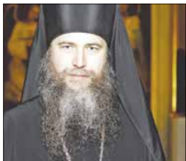
Trakų vyskupas Ambrosijus Teologijos studijų vadovas

Palaiminus Vilniaus ir Lietuvos metropolitui Inokentijui, spalio 1 Vilniuje pradėtos arkivyskupijos Teologijos studijos. Viena šių studijų krypčių - katechetų rengimas. Ko bus mokomi ir kuo tapti pašaukti žmonės, pasirinkę šią kryptį?