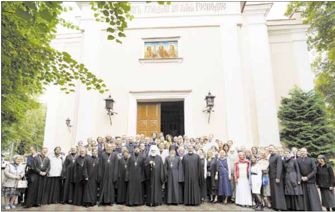
► Teologijos studijų atidaryme dalyvavo daugiau nei 80 Lietuvos stačiatikių parapijų narių, kurie mokysis kuriame nors iš keturių skyrių: ganytojų, katechezės, chorinio dirigavimo bei giedojimo ir ikonų tapyto.