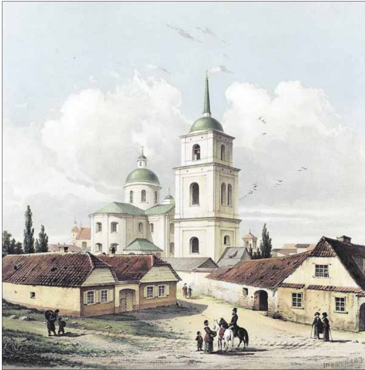
► Šv. vienuolis Leontijus (Karpovičius) buvo Šventosios Dvasios vienuolino įkūrėjas ir pirmasis jo vadovas. Yra duomenų, liudijančių, kad šventosios jo relikvijos iš pradžių buvo šiame vienuolyne, todėl gali būti, kad ir dabar kažkur čia ilsisi.