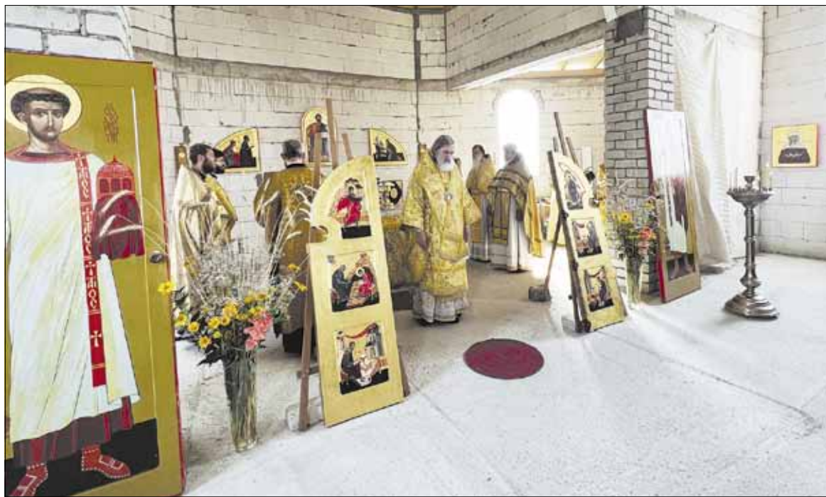
► Hierarchas Liturgiją celebravo nors ir nebaigtoje statyti, bet ikonostaso ikonomis papuoštoje šventovėje. Ikonostasą šv. Tichono parapijai padovanojo Mikniškių bendruomenė.

2025 metais parapija minės savo trisdešimties metų sukaktį, o visa mūsų Bažnyčia - šimtą metų nuo šventojo hierarcho Tichono, mūsų parapijos Dangiškojo globėjo, mirties. Norėtume, kad šias iškilmes švęstume naujojoje cerkvėje, ir jau