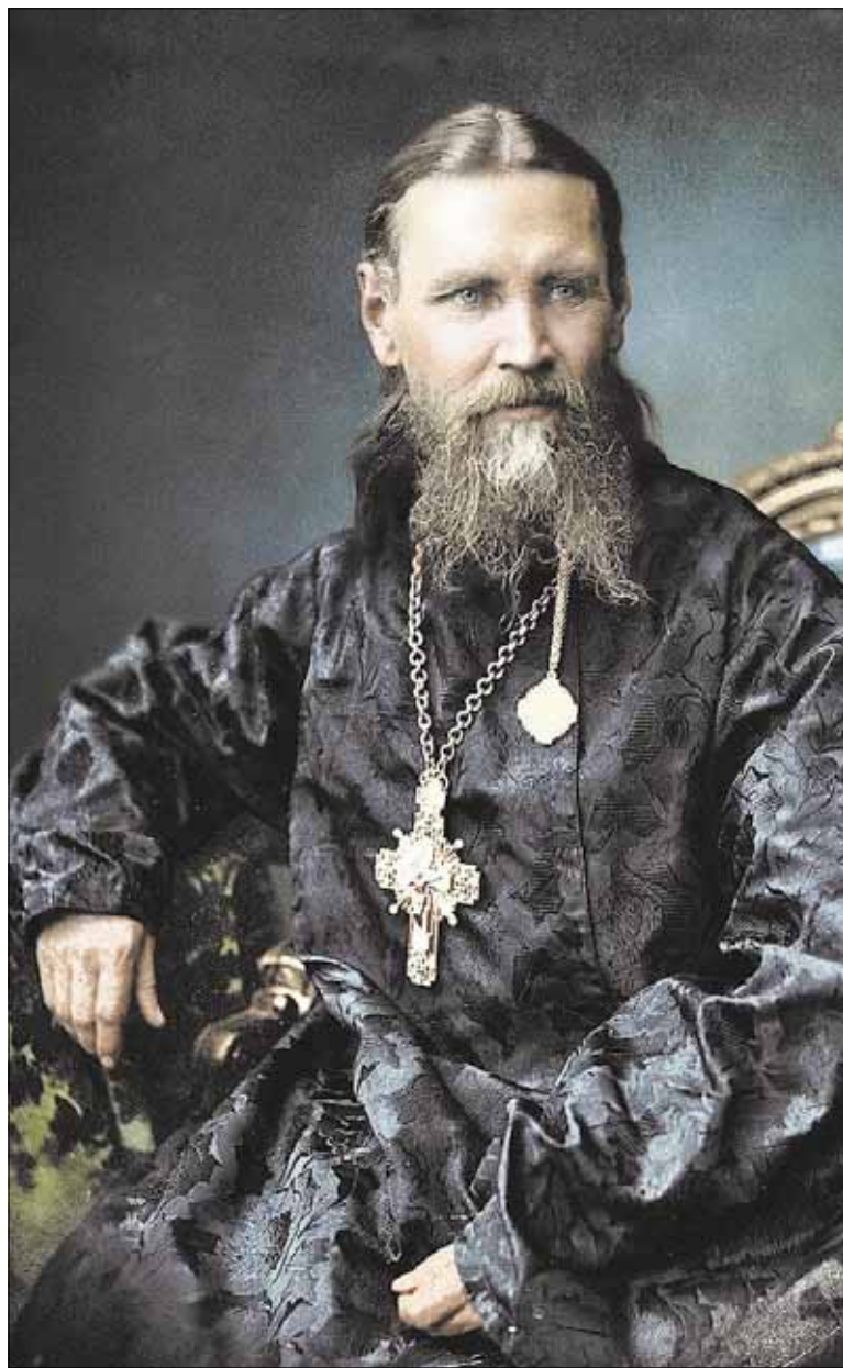
► Šventasis teisusis Joanas Kronštatietis.