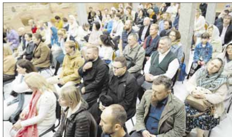
► Būsimieji katechetai, dvasininkai ir kiti Bažnyčios tarnautojai, giedotojai ir ikonų tapytojai susirinko Šventosios Dvasios vienuolyno konferencijų salėje į iškilmingą Teologijos studijų atidarymą.

ne vienerius metus. Šiuolaikiniai žmonės dažnai nejučia poreikio rimtai ir išsamiai imtis kokių nors dalykų nagrinėjimo. Deja, tai pasakytina ir apie religiją, todėl norintieji krikštintis, tapti krikščionimis ar pageidaujantieji daugiau sužinoti apie Stačiatikybę nelinkę ilgai katechizuotis ir dar padedami katecheto.