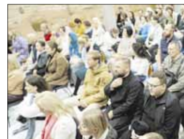
Vilniuje atidarytos Teologijos studijos