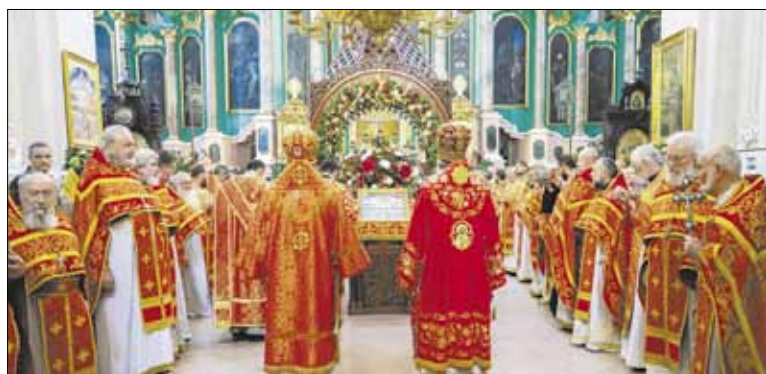
► Iškilmingose pamaldose Šventosios Dvasios vienuolyne dalyvavo visi Lietuvos Stačiatikių Bažnyčios klero nariai.