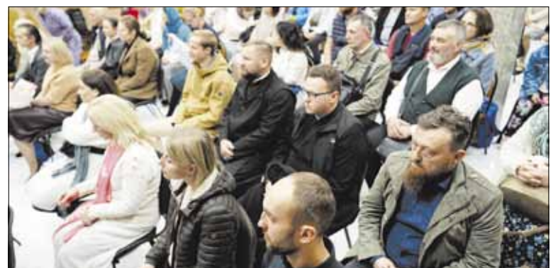
► Į antrąjį kursą perėję besimokantieji stačiatikių studijose rengiasi naujų mokslo metų pradžia.