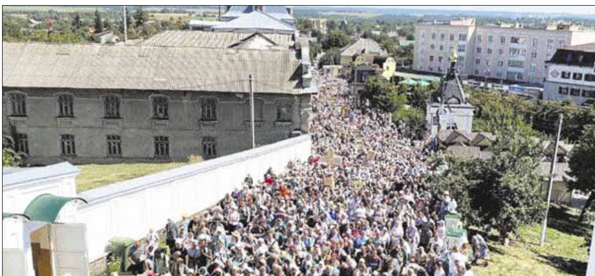
► Nuotraukoje: tradicinė tikinčiųjų, priklausančių USB, religinė procesija į Počajivo laurą šįmet buvo itin gausi.

Vilniaus ir Lietuvos metropolito Inokentijaus nurodymu visose Lietuvos stačiatikių šventovėse kasdien bus meldžiamasi už persekiojamą Ukrainos Stačiatikių Bažnyčią (USB), kurios vadovas yra Jo Eminencija metropolitas Onufrijus.