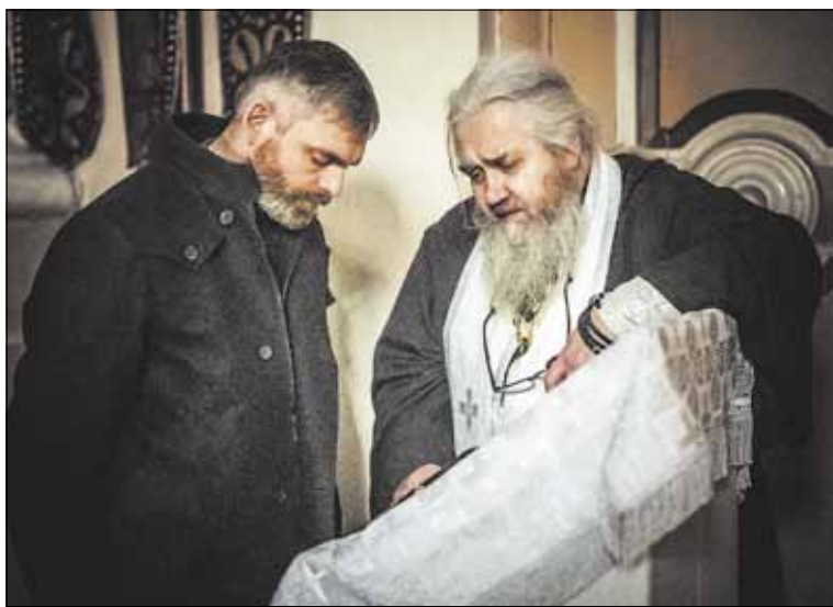
► Dvasininkai įspėja, kad formali išpažintis pavojinga.

to, toks piktžodžiavimas – tai aki-vaizdus netikėjimas, bedievytė, taip pat netikėjimas, kad Dievas, apskritai atleidžia nuodėmes (tai – Šv. Maksimo Išpažinėjo požiūris). Šv. Ignacijus Briancaninovas rašo, kad nenoras atsisakyti eretzijos, atkaklus jos laikymasis, taip pat Bažnyčios (Kristaus Kūno) skaldymas yra piktžodžiavimas Šventajai Dvasiai. Labai svarbu, kad abiem šiemis aiškinimams būdingas vienas itin reikšmingas dalykas: juose vieningai pabrėžiamas nenoras atsisakyti nuodėmingo požiūrio ir nenoras atgailauti. Nuo paties žmogaus priklauso, ar jam bus atleista. Viešpats nekinta, todėl nekinta ir Jo gailestingumas bei meilė. Todėl žmogus gali nuolat sulaukti Jo malonių: atleidimo, pagydymo. Tačiau paklauskime, ar žmogus galės priimti Dievo malonę, jeigu