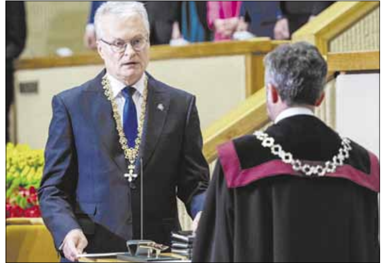
► Antros pagal dydį religinės bendruomenės Lietuvoje atstovų nebuvo Prezidento inauguracijoje.