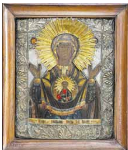
► Dėkodami už įvykusius stebuklus, tikintieji Dievo Motinos atvaizdui aukoja aukso kryželius, grandinėles ir žiedus.