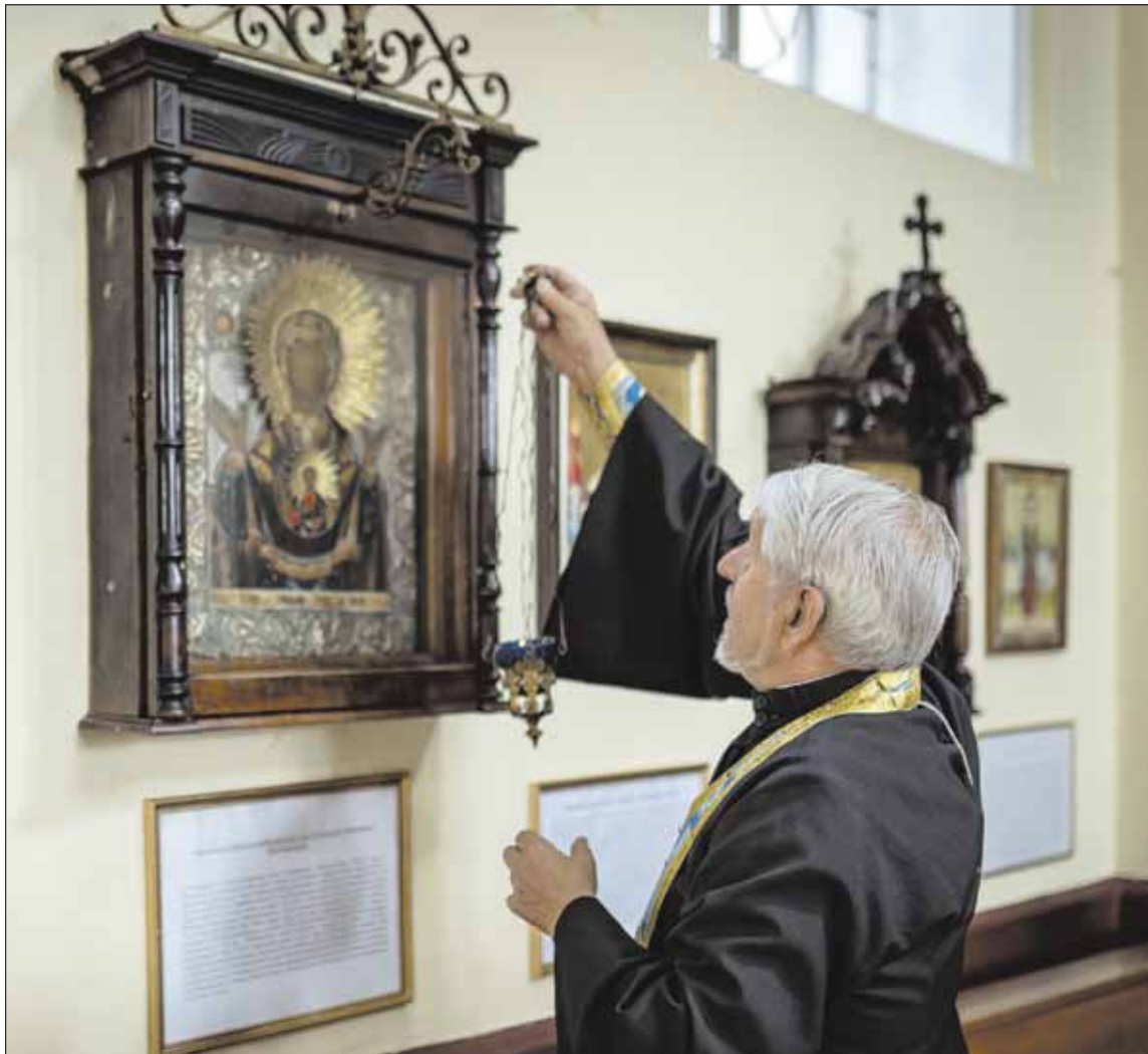
► Vėl įgytoji stebuklingoji ikona yra Vilniaus Ženklo (iš Dangaus) šventovėje (Vilnius), kairėje navoje.

Tapęs šios šventovės klebonu (baigiantis devintajai praėjusio šimtmečio dekadai), tėvas Petras Miuleris po kiek laiko perkėlė iko-