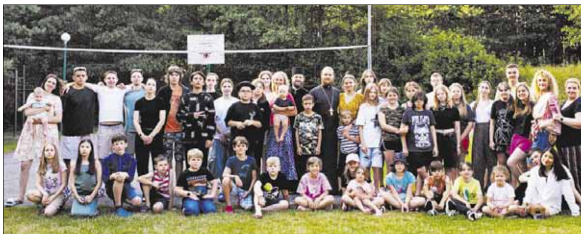
► Daugelis sekmadieninių mokyklų auklėtinių šią vasarą turėjo galimybę pailsėti stačiatikiams skirtose stovyklose.

Stačiatikių šeimų atžalos vasarą turėjo galimybę pailsėti Lietuvos Stačiatikių Brolijos organizuotose stovyklose. Pirmoji vaikų stovyklos pamaina nuo liepos 6 iki 17 d. veikė Melnragėje (Klaipėda). Joje išsėjosi sekmadieninių mokyklų auklėtiniai iš daugelio mūsų šalies miestų ir miestelių bei pabėgėlių iš Ukrainos vaikai.