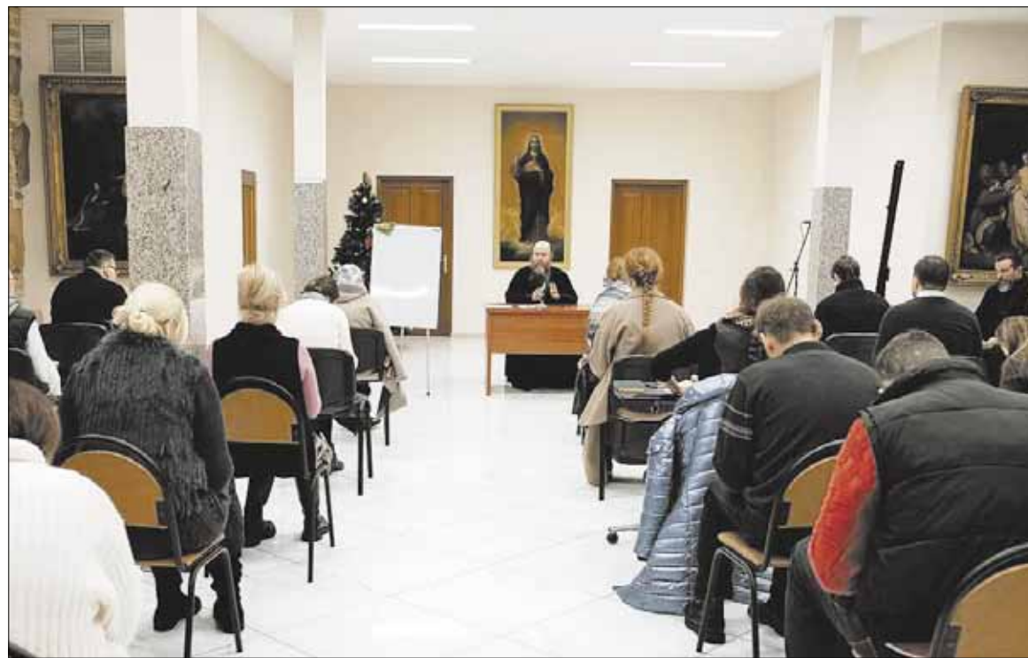
► Jau netrukus, 2024 m. spalį, vėl vyks užsiėmimai Teologijos studijose.

Visi be išimties besimokantieji šalia įvairių specialių, jų veiklai skirtų dalykų, nagrinės ir sudėtingus teologijos dalykus, kaip antai Katekizmas, o iš esmės – dogminę teologiją, Senąjį ir Naująjį Testamentą bei Liturgiką. Ir kiekvieną semestrą vyks šių disciplinų egzaminai, bus laikomos įskaitos.