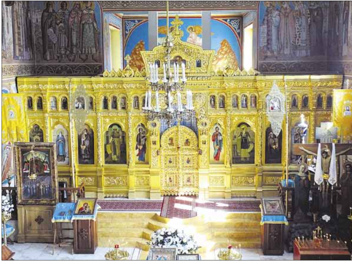
► Klaipėdos m. „Visų Rusios Šventųjų“ cerkvės ikonostasas.