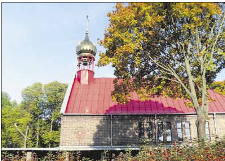
► Visų Rusios Šventųjų cerkvė Klaipėdoje.