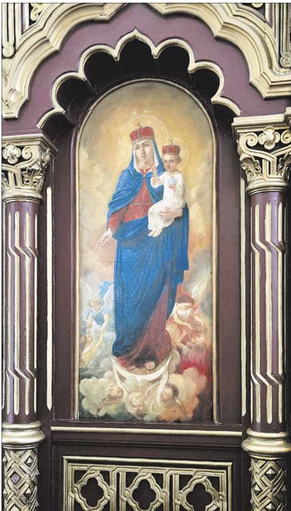
► „Vilniaus“ (viso ūgio) Dievo Motinos ikona. Skaisčiausiosios katedros ikonostaso fragmentas.

Nekyla abejonių, kad „Vilniaus“ viso ūgio ikona senovėje Lietuvoje buvo itin gerbiama. Šį teiginį patvirtina ir faktas, kad XVII a. Vilniaus Bernardinų vienuolynui buvo nutapytas katalikiškas šios ikonos variantas. Tai vadinamoji „Sapiegų Madona“. Priėmus Brastos (Bresto) uniją LDK aristokratai, pereinantys iš Stačiatikybės į Katalikybę, davė pradžią stačiatikių ikonų kopijavimui, bet vadovaujantis to meto katalikiškąja tradicija. Šie paveiksliukai buvo tapomi katalikų bažnyčioms. Juos užsakinėjo Sapiegos, Chodkevičiai, Radvilos ir kt. Visgi „Sapiegų Madona“ ikonografijos požiūriu nusileidžia senajai stačiatikių ikonai.