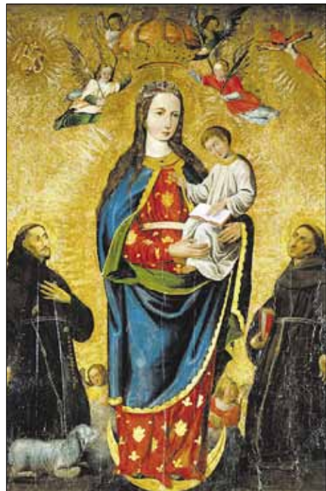
► Katalikiškoji „Sapiegos Madona“.

Na, o pati „Vilniaus“ (viso ūgio) ikona Lietuvoje liko labiau žinomą ir uoliau gerbiamą ikonų šešėlyje. Tačiau, matyt, atėjo laikas iškelti šį paveikslą iš šešėlio ir pradėti reikšti jam pelnytą, deramą pagarbą.