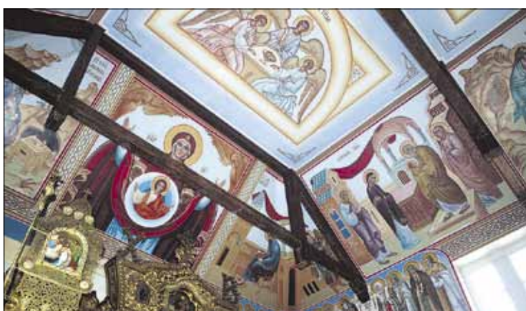
► Visų Rusios Šventųjų cerkvės lubų puošyba.

Kitų apatinio registro ikonų autoriai nežinomi. Vienas jų nutapė šv. Nikolajaus Myriečio ir apaštalam lygaus šv. kunigaikščio Vladimiro paveikslus. Jie tapyti ant lentų, kurios didintos iš viršaus ir apačios. Iš to daroma išvada, kad iš pradžių ikonos tapytos kitam ikonostasi. Kitas (ne toks įgudęs) nežinomas tapytojas atliko šiuos darbus: šv. ištikimojo kunigaikščio Aleksandro Neviečio ir šv. vienuolio Nilo Stolobniečio paveikslai. Jie tapyti ant drobės ir taip pat nėra