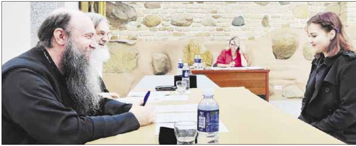
► Hierarchai pavedė įžanginius pokalbius su norinčiais įstoti į Teologijos studijas.

— Pernai į Teologijos studijas įstojo daugiau nei aštuoniasdešimt žmonių. Kiek jų tęs studijas?