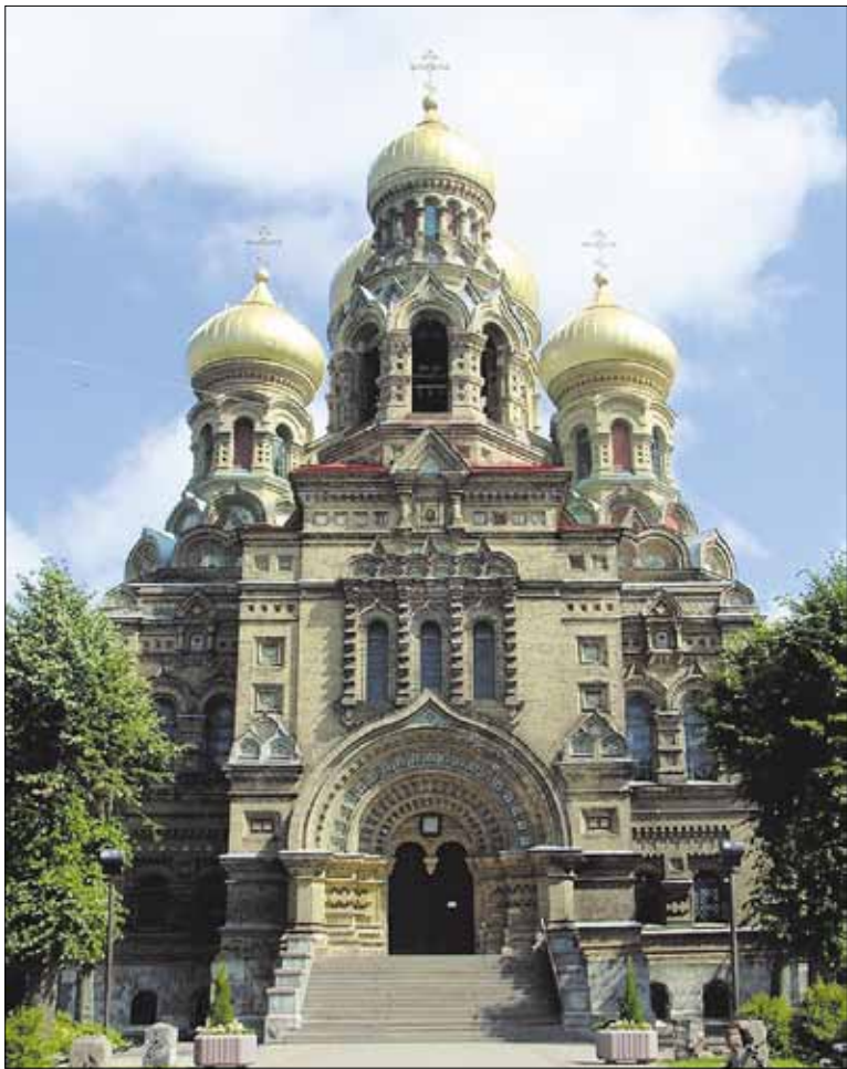
► Nikolajaus katedra Liepojos m.