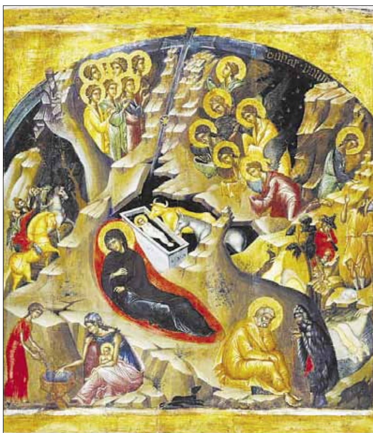
▶ Ikonas „Kristaus Gimimas“.

Adventas - vienas seniausių pasninkų. Apie jo buvimą užsimena jau šventasis hierarchas Ambraziejus Milanietis (†397 m.) bei šventasis Hipo vyskupas Augustinas (†430 m.), kuris vienu metu buvo Ambraziejaus mokinys. O Romos vyskupas Leonas I Didysis (†461 m.) vadino Adventą seniai įvestu, o dar - auka Dievui už vasaros ir rudens derlių. Tiesa, iš pradžių Bažnyčios nariai pasninkaudavo prieš Dievo Apsireiškimo šventę, nes anuomet Kristaus Gimimą vadino Dievo Apsireiškimu pasauliui. O šventė, kurią dabar vadiname Dievo Apsireiškimu, - Viešpaties Krikštą - buvo sujungta su „pagrindiniu“ Dievo Apsireiškimu. Abi šventės sudarė vieningą šventinimo ciklą, besitęsiantį kelias dienas.