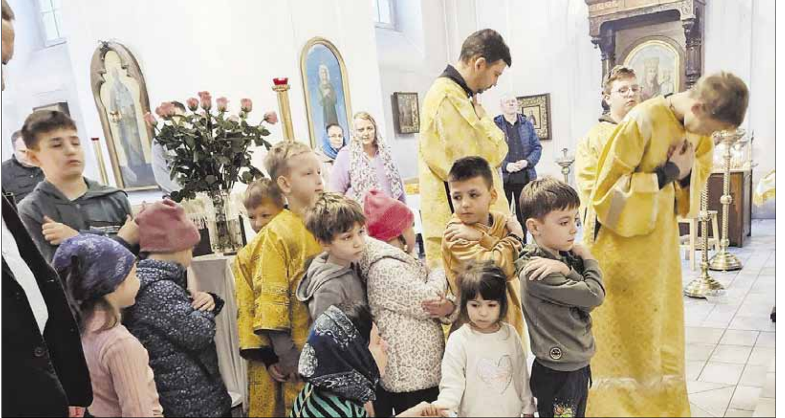
► Vaikams skirta Liturgija Vilniaus Mykolo šventovėje. Švenčiausiųjų Slėpinių suteikimo laukianti eilė.