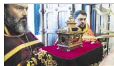
Vyskupas Ambrosijus apie šventenybių pagerbimą