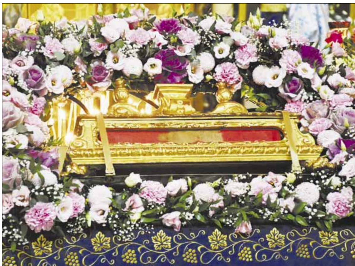
▶ Relikvinė su Dievo Motinos Skraiste, kuri bus Vilniuje

Kadangi tai bendros visų krikščionių šventenybės, šventovės durys, aišku, bus atviros visiems krikščionims, nepriklausomai nuo konfesijos. Maža to, Vilniaus ir Lietuvos metropolitas Inokentijus kreipėsi į brolius ir seseris katalikus, kviesdamas juos kartu su mumis patirti šį dvasinį džiugesį.