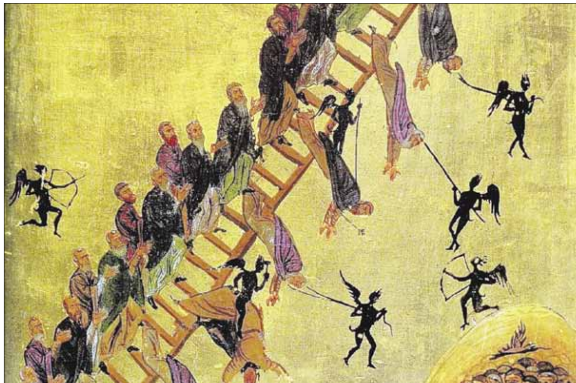
► Ikona „Jono Klimako Kopėčios“.

Tegul Didžiai Gailestingas Viešpats Jėzus Kristus visus mus sustiprins, palaimins ir mūsų visų pasigailės!