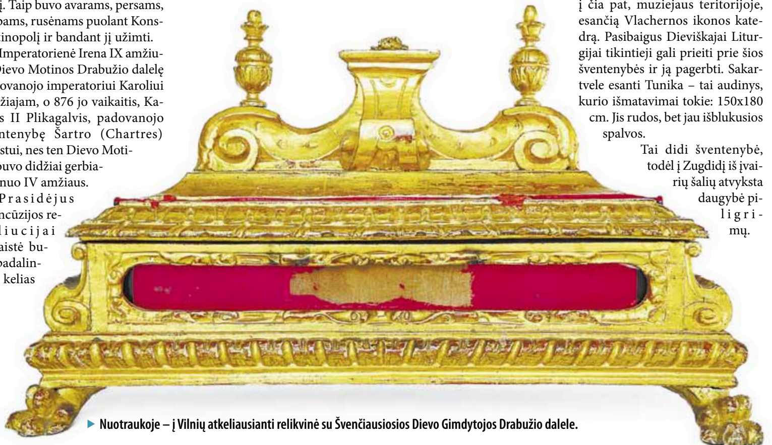
► Nuotraukoje – į Vilnių atkeliausianti relikvinė su Švenčiausiosios Dievo Gimdytojos Drabužio dalele.

yra apie dviejų metrų ilgio ir 46 centimetrų pločio. Ekspertizė nustatė, kad audinys yra išlikęs iš I tūkstantmečio pradžios. Dievo Gimdytojos Drabužių dalių yra ir