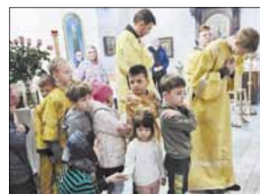
Kunigo atsakymai į parapijiečių klausimus