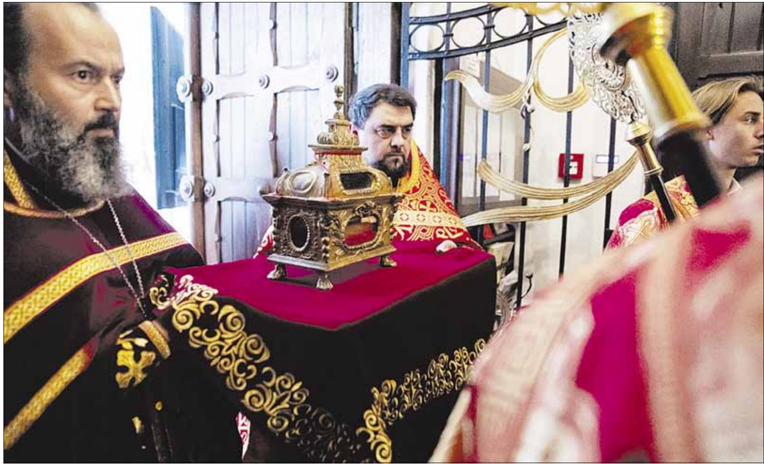
► Tai relikvinė su viena didžiausių iki šiol pasaulyje išlikusių Viešpaties Kryžiaus dalių. Ši šventenybė bus atnešta į Vilnių.

Šventiesiems daiktams priskiriami ir kulto reikmenys bei dvasininkų drabužiai. Tai reikmenys, kurie pasitelkiami Eucharistijai: Taurė, patena (diskas), ietelė, šaukštelis. Jų reikia Švenčiausiesiems Slėpiniams pa-