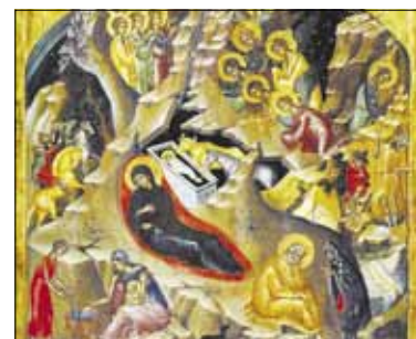
Kodėl reikia pasninko prieš Kalėdas?