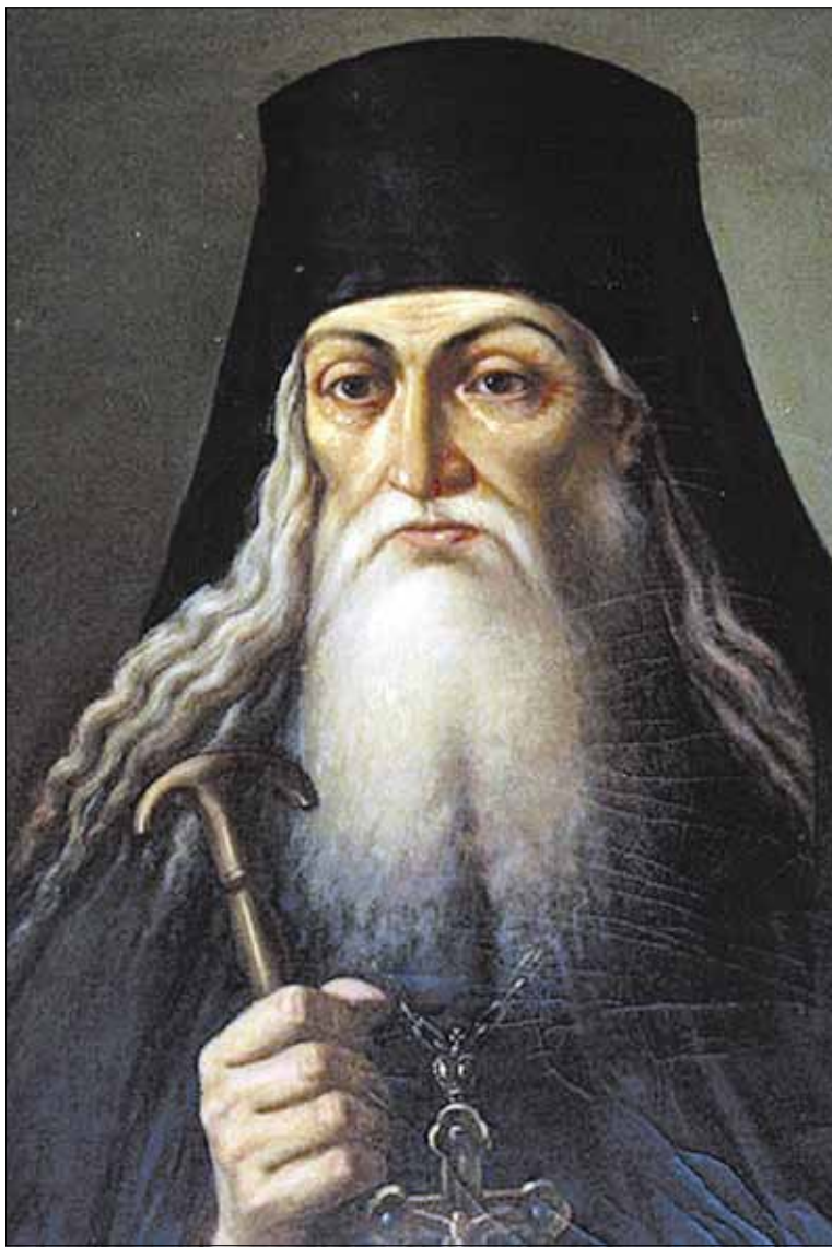
► Šventasis vienuolis Paisijus Veličkovskis.