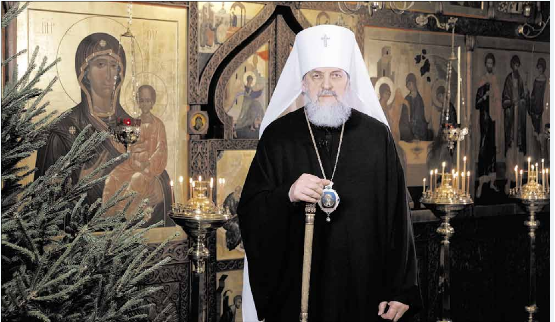
► Lietuvos Stačiatikių Bažnyčios vadovas, metropolitas Inokentijus, pasveikino tikinčiuosius su Šv. Kalėdomis.