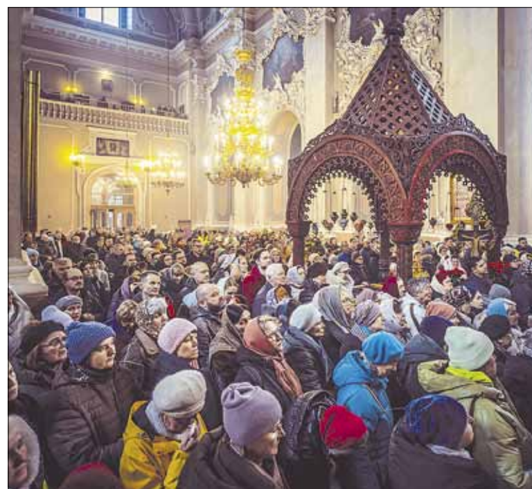
► Per savaitę, kol Šv. Dvasios vienuolyne buvo šventosios relikvijos, prie jų meldėsi tūkstančiai tikinčiųjų.