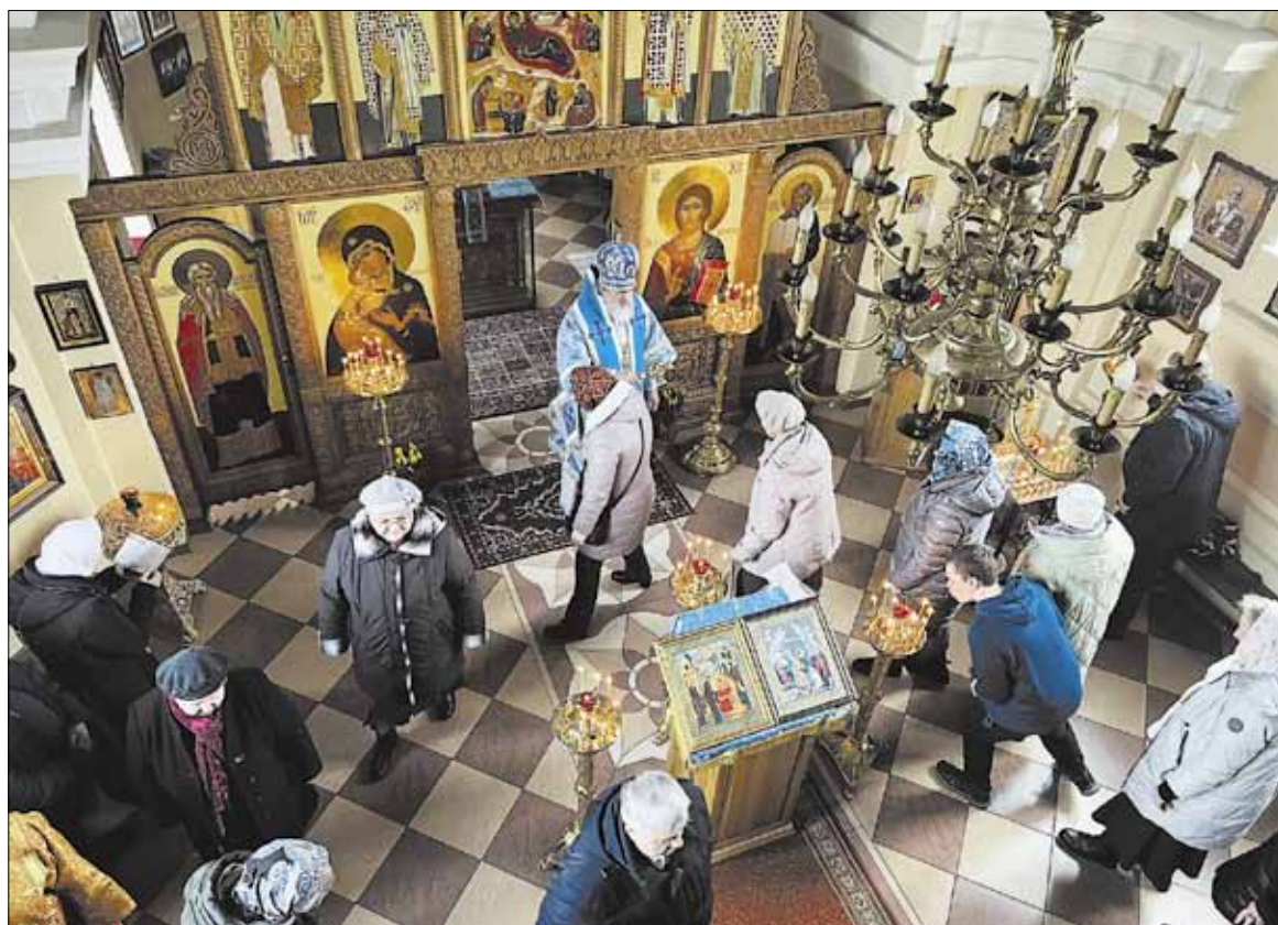
► Liturgiją Kristaus Gimimo šventovėje celebruoja archierejus.

Straipsnį parengė Bukiškių Kristaus Gimimo cerkvės parapijiečiai