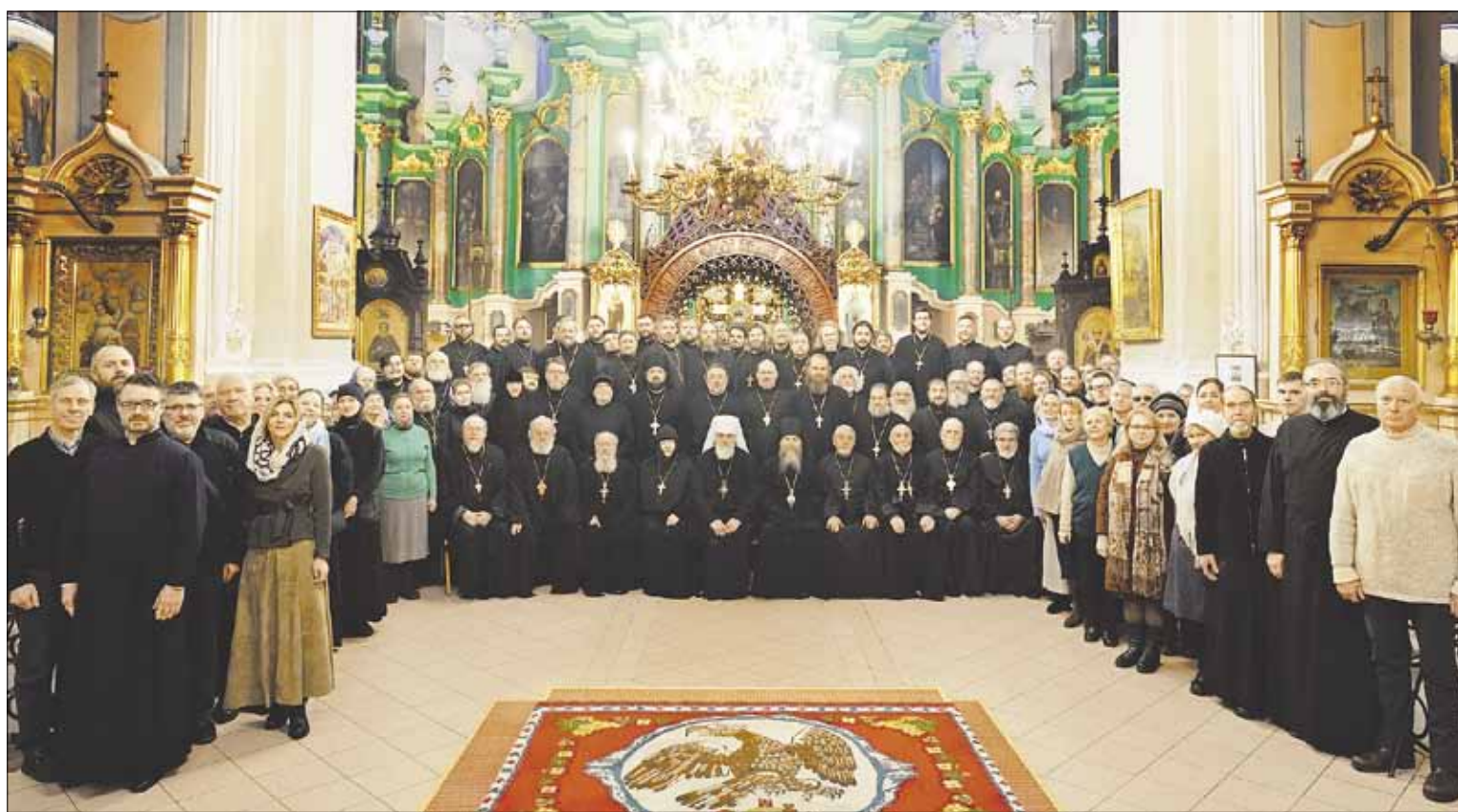
▶ Lietuvos Stačiatikių Bažnyčios klero nariai, vienuoliai ir pasauliečių atstovai susirinko Vilniuje aptarti metų rezultatų.

2024 metų gruodžio 27 Vilniuje, Šventosios Dvasios vienuolyno konferencijų salėje, įvyko kasmetinis Lietuvos Stačiatikių Bažnyčios Visuotinis surinkimas, kuriam pirmininkavo Vilniaus ir Lietuvos metropolitas Inokentijus.