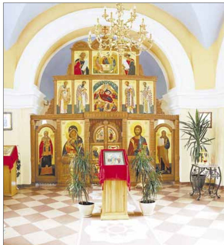
► Kristaus Gimimo šventovės Bukiškėse ikonostasas.

Kai gyvename, vadovaujamiesi savo valia, - patys save kan Kiname, o gyventi paklusus Dievo valiai - gera, džiugu ir ramu. ŠVENTASIS SILVANAS ATONIETIS