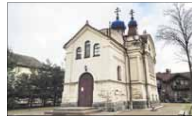
Kristaus Gimimo šventovės istorija