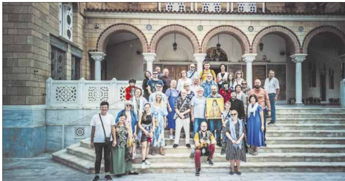
► Romanovų šventovės parapijiečių piligrimystė į Graikiją.

Viena Lietuvos Stačiatikių Brolijos veiklos sričių – piligriminių kelionių organizavimas. Detalesnė informacija apie planuojamas keliones vėliau bus skelbiama mūsų laikraštyje, Lietuvos Stačiatikių Bažnyčios paskyroje bei socialiniuose tinkluose.