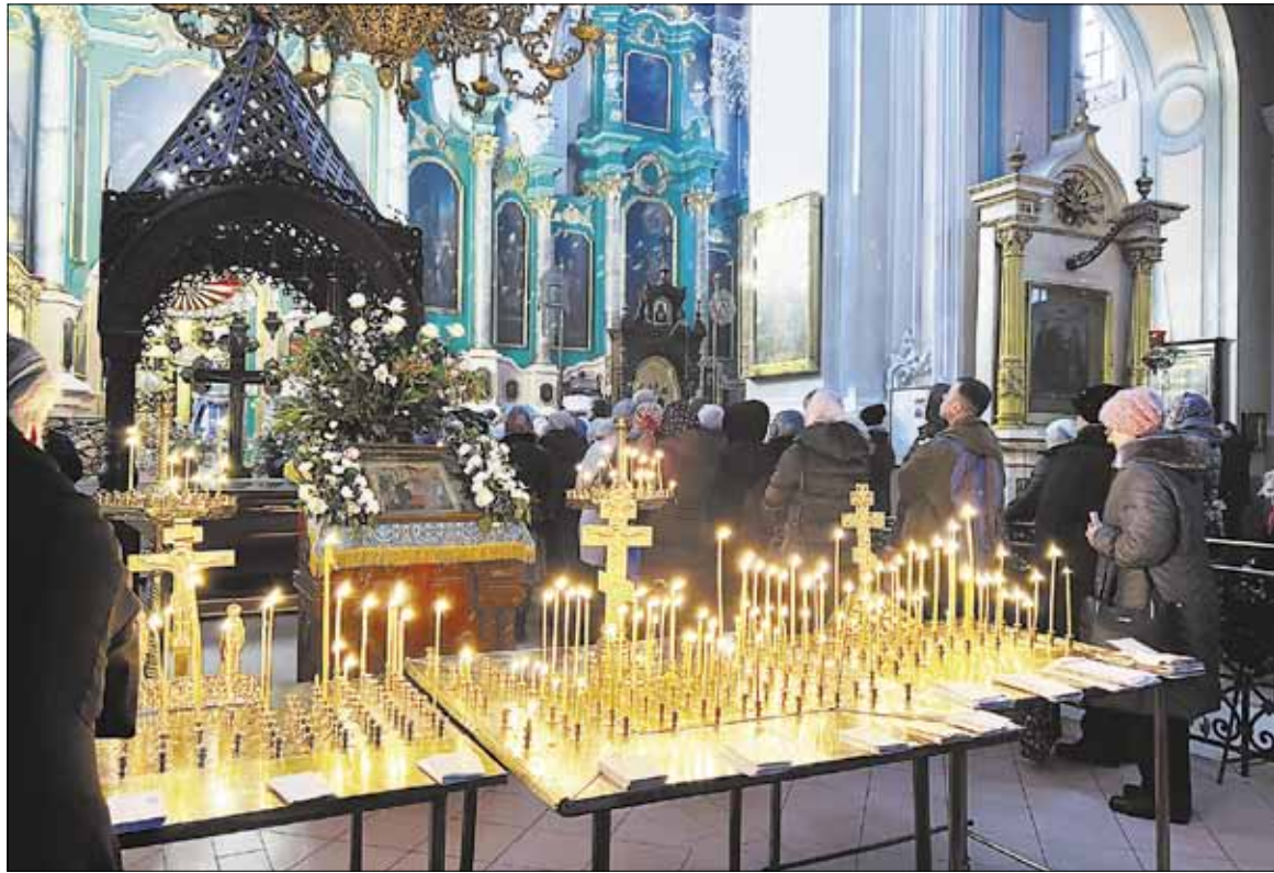
► Tėvų šeštadienis Šv. Dvasios vienuolyne.

— Per išpažintį kunigas paklausė, ar aš kokiam nors žmogui nejučiu blogų jausmų. Atsakiau, kad nejučiu, nors iš tikrųjų neįmanoma pasiekti, kad būtum beaistris su aplinkiniais, tarsi angelas. Kaip patartumėte atsakyti į minėtą dvasininko klausimą, jeigu jis vėl bus užduotas?