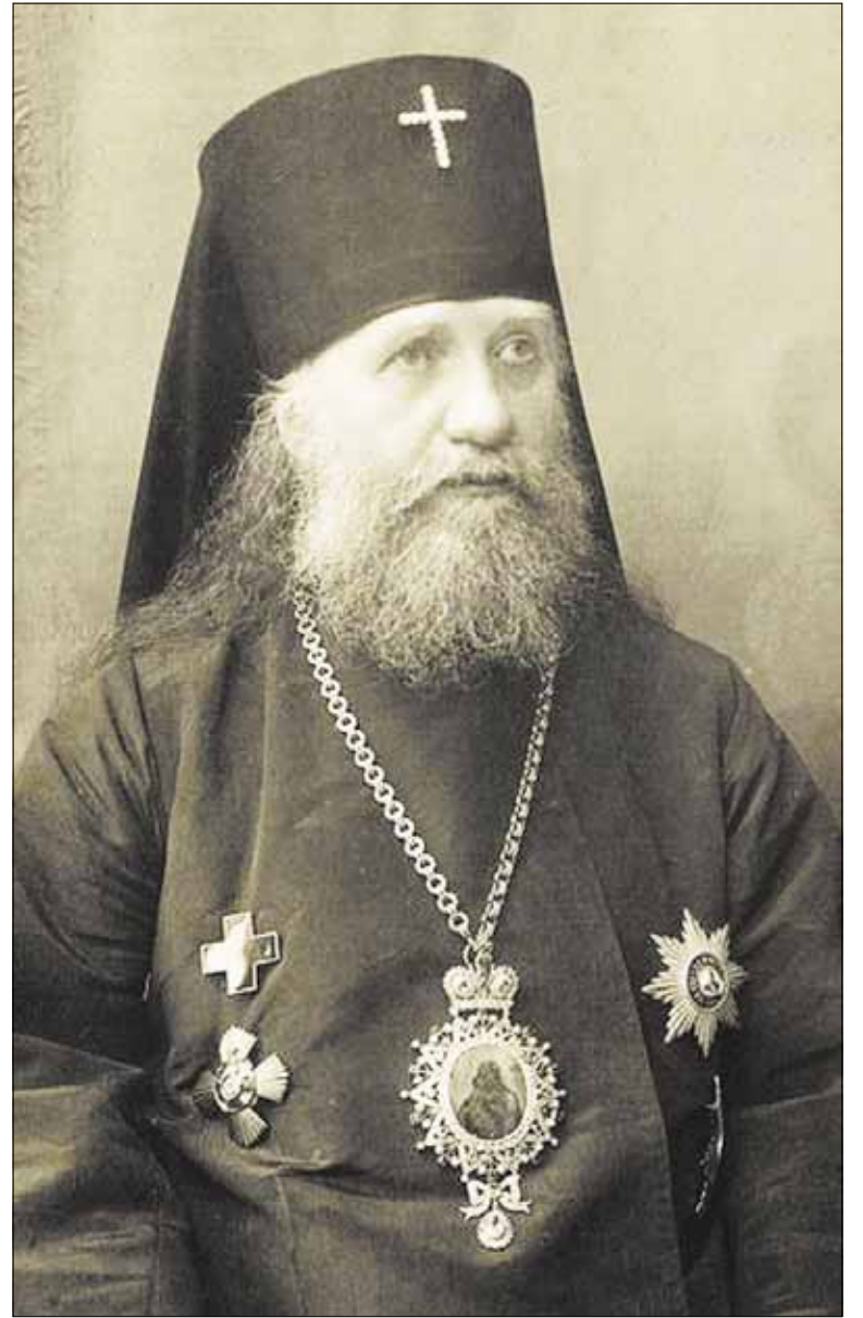
► Šv. hierarchas Tichonas dar būdamas Vilniaus ir Lietuvos arkivyskupu.

Kitą dieną, spalio 10 d. , Šventosios Dvasios vienuolyno prasidės konferencija, skirta šventojo Tichono palikimui Stačiatikybės Lietuvoje istorijoje.