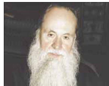
Metropolitui emeritui Chrizostomui atminti