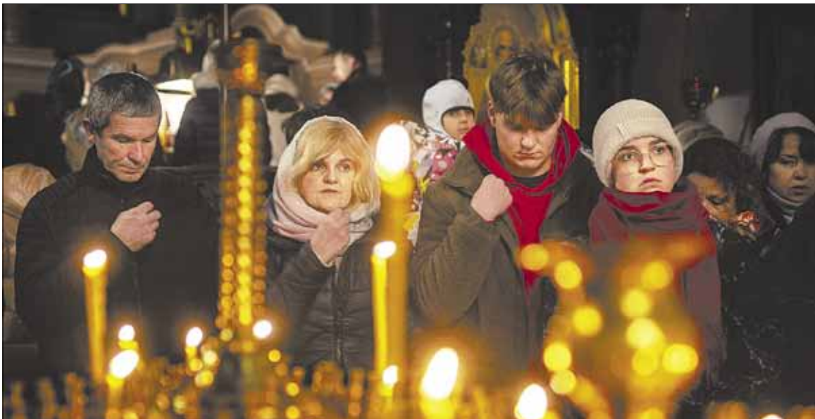
▶ Ikona padeda susikaupti maldai, be to, ji mums byloja apie dvasinio pasaulio šventumą.