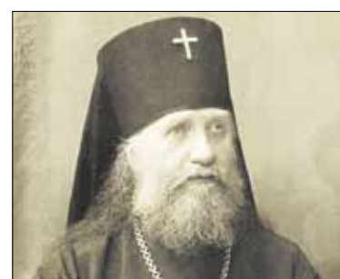
Patriarcho Tichono metai: šventinių renginių programa