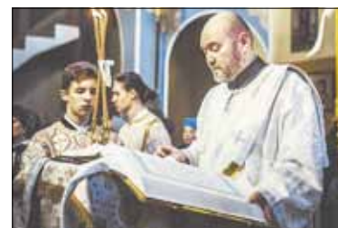
Nuo mokslų prie tarnystės