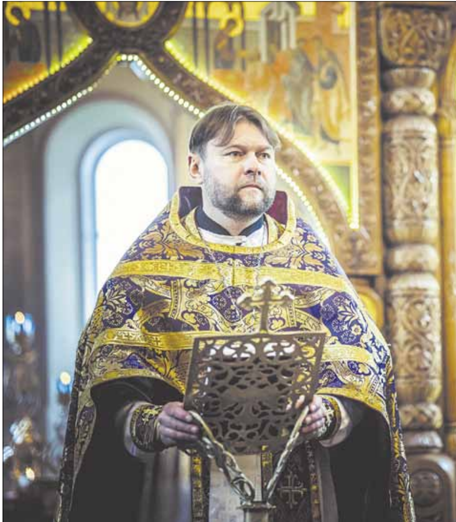
► В Пятницком приходе служит священник-украинец из канонической Украинской Православной Церкви.

«Конечно, на наши богослужения приглашаются не только украинцы, но и все желающие. Однако в первую очередь мы стремимся к созданию всех необходимых условий для наших соотечественников-украинцев, чтобы они могли молиться так, как привыкли это делать у себя на родине», - отметил священник.