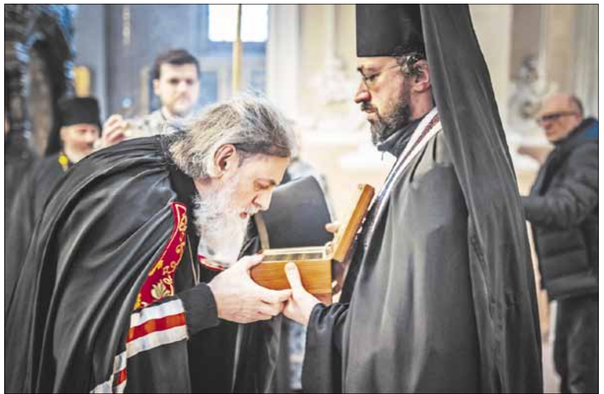
► На снимке: благочинный Свято-Духова монастыря игумен Антоний (Гуринович) передает ковчег с частицами мощей святых угодников Божиих митрополиту Виленскому и Литовскому Иннокентию.

6 апреля, накануне праздника Богородицы, завершилось принесение великой святыни - ковчега с частицами мощей святых угодников - в центры благочиний Литовской Православной Церкви.