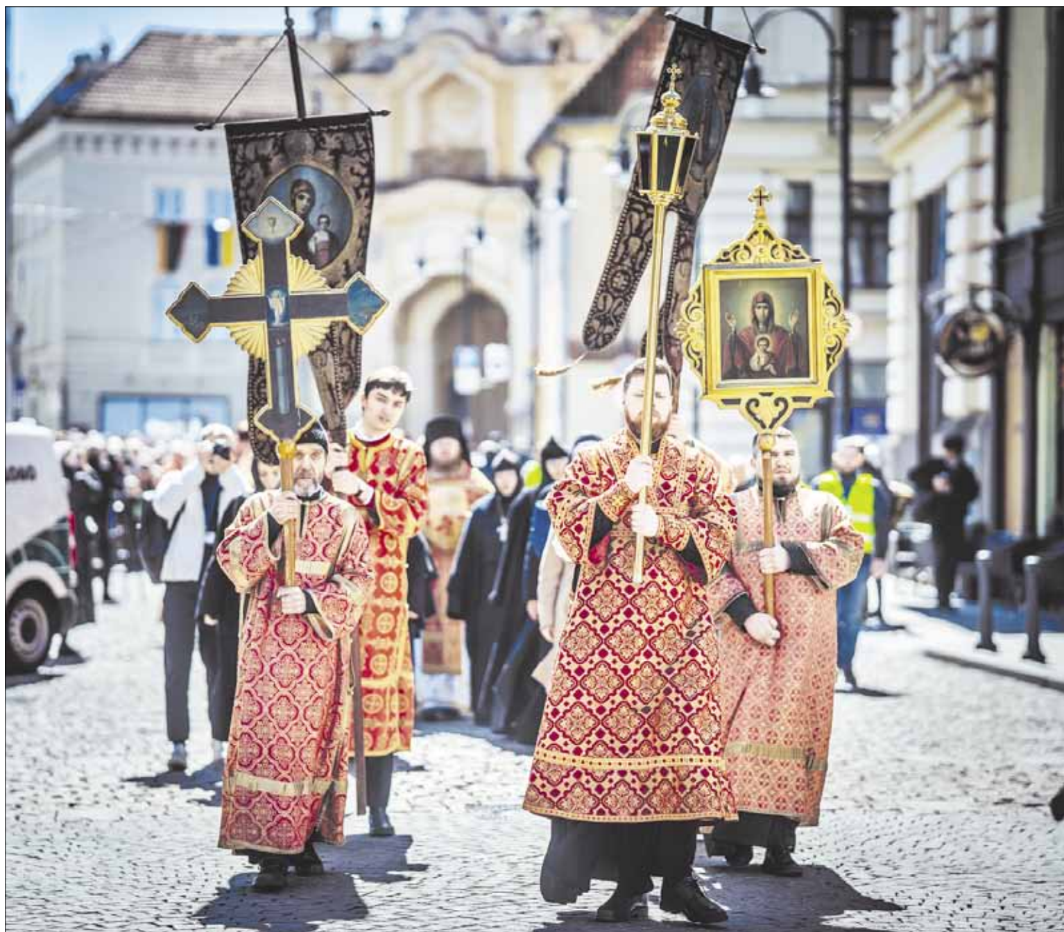
► Большой крестный ход за единство Церкви пройдет при участии всего духовенства и прихожан храмов Литовской Православной Церкви. На снимке: прошлогодний крестный ход за единство Церкви.

В субботу, 29 апреля, в Вильнюсе пройдет большой Крестный ход, в котором примут участие все священнослужители Литовской Православной Церкви и прихожане православных храмов со всех уголков Литвы.