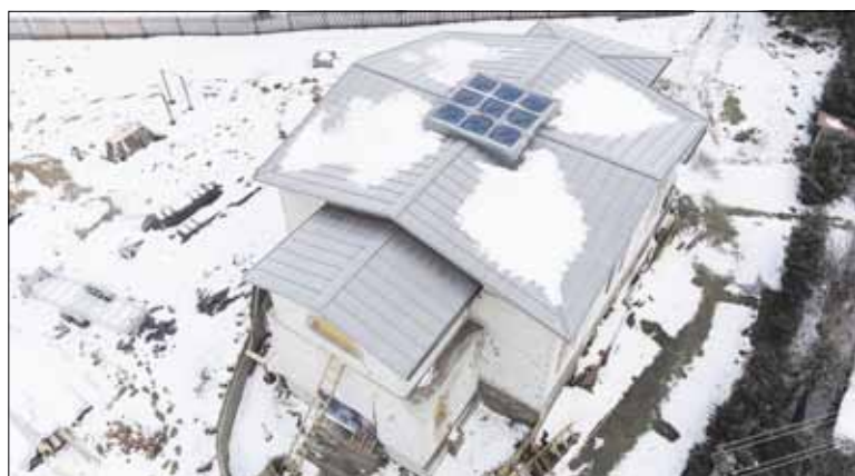
► Строящийся храм с высоты птичьего полета.

В городе Шальчининкай продолжается строительство Свято-Тихоновского храма. На очереди возведение купола и воздвижение креста.