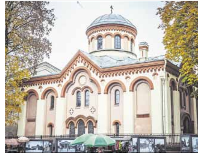
Расписание богослужений украинской общины в Пятницком храме www.facebook.com/ukrparaskeva

украинцы есть практически в каждом литовском православном храме. Литовская Православная Церковь уделяет большое внимание оказанию беженцам всесторонней помощи - как духовной, так и социальной.