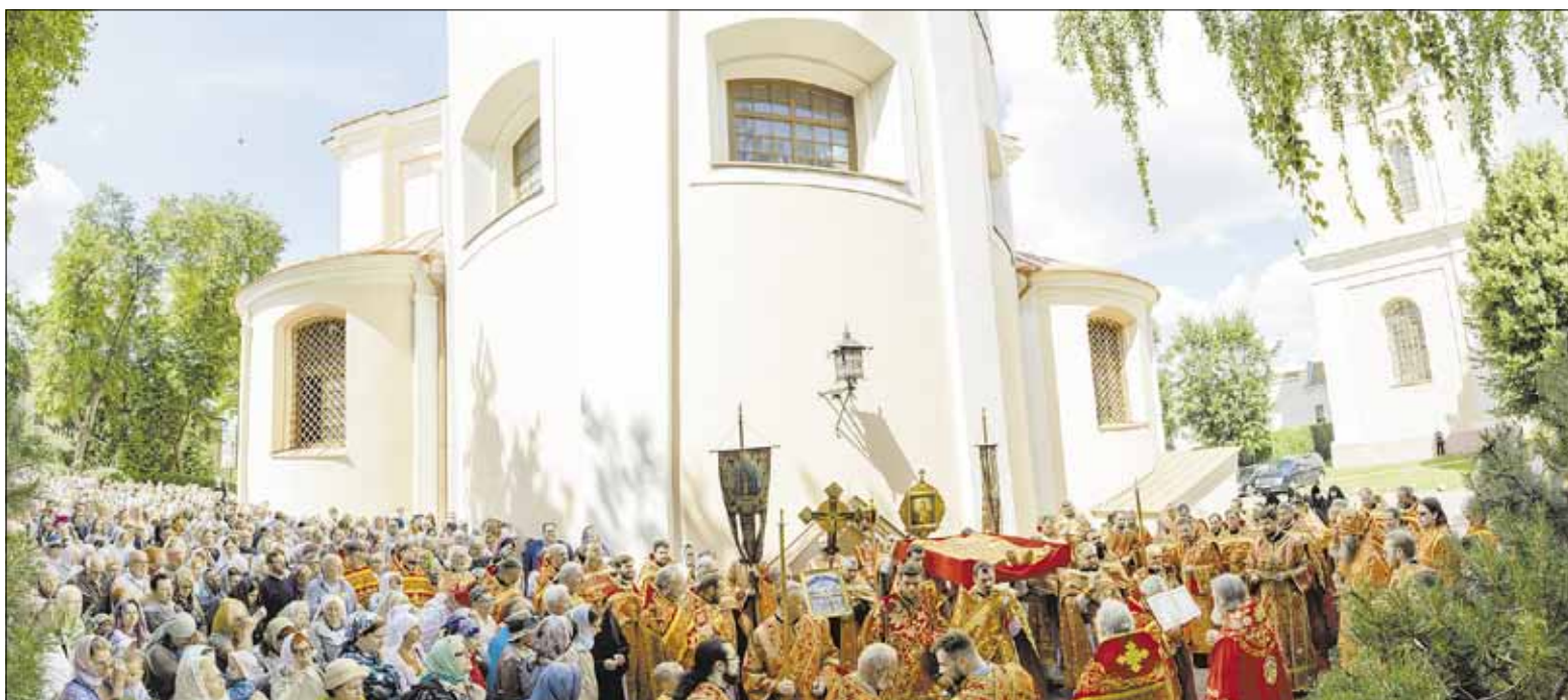
► В праздник всех святых, в земле Литовской просиявших состоялся многолюдный крестный ход, в ходе которого мощи свв. Виленских мучеников были обнесены вокруг монастырского храма.