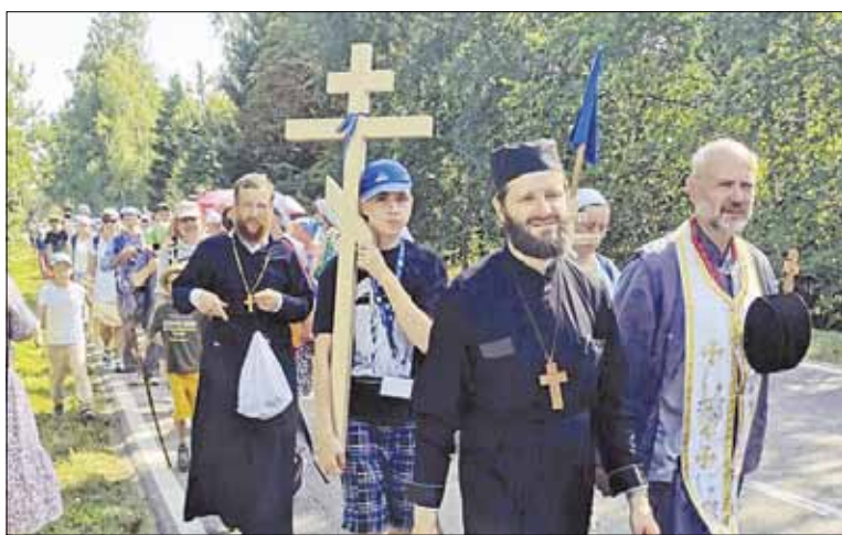
► В крестном ходе до Святой горы Грабарка приняли участие паломники из Литвы.

19 августа, в праздник Преображения Господня, паломничество завершилось торжествен-