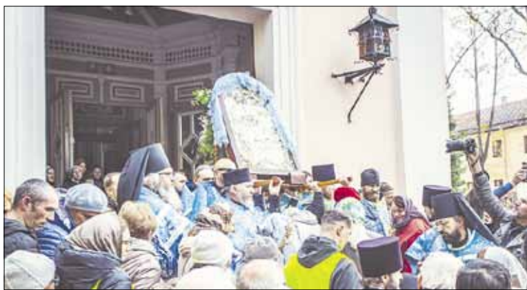
► В прошлом году в крестном ходе по случаю принесения Сурдегской иконы Божией Матери приняли участие тысячи верующих.

После Литургии святой образ при участии сонма священнослужителей и множества мирян, прибывших в столицу из всех уголков Литвы, будет перенесен крестным ходом из Свято-Духова монастыря в кафедральный Пречистенский собор (ул. Майроне, 14), где икона останется в течение недели. В течение нескольких дней все желающие смогут поклониться чудотворному образу и приложиться к нему.