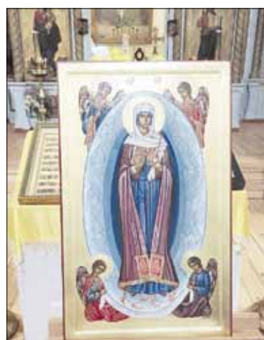
► Новая икона, написанная на Афоне для шяуляйского храма.

13 августа в Петропавловском храме г. Шяуляй после Божественной литургии был впервые совершен молебен с акафистом перед иконой Матери Божией «Благословляющая», доставленной в храм со святой горы Афон.