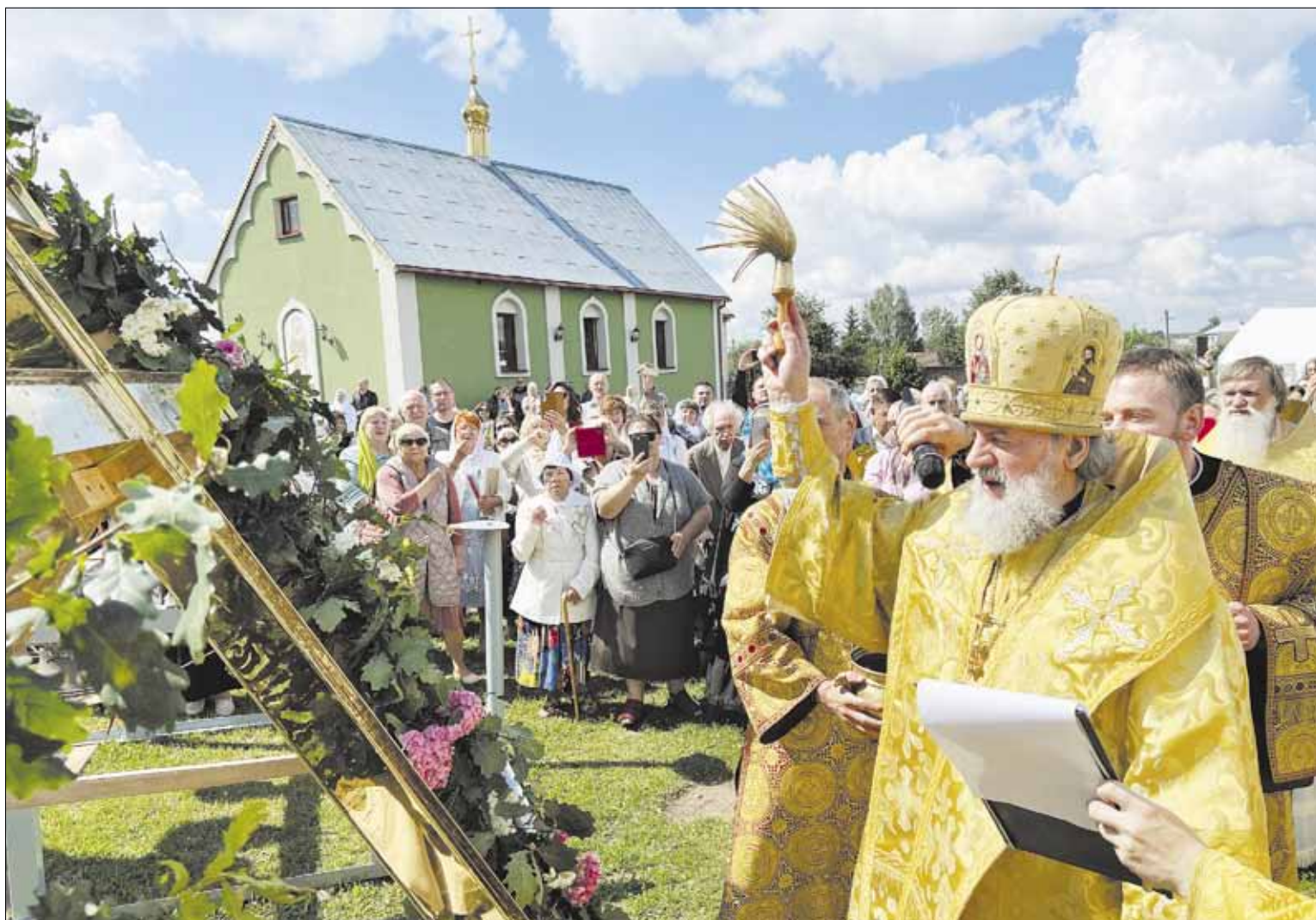
► Митрополит Иннокентий освятил водружаемый над Свято-Тихоновским храмом крест. Затем все присутствующие к нему приложились.

На исходе июля в городе Шальчининкай состоялось большое торжество по случаю водружения креста над строящимся Свято-Тихоновским храмом. Крест освятил предстоятель Литовской Православной Церкви митрополит Иннокентий, который также возглавил Божественную литургию.