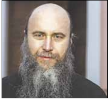
Епископ Тракайский АМВРОСИЙ

В этом году по благословению митрополита Виленского и Литовского Иннокентия в Литве организовываются Православные богословские курсы. Пастырское отделение курсов является одним из важнейших, ведь именно будущие пастыри несут наибольшую ответственность, исполняя свое служение.