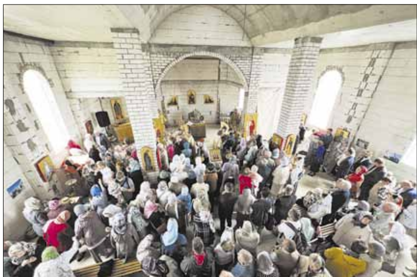
► Строящийся храм впервые наполнился молящимися. На богослужении присутствовали гости из окрестных приходов.

Окончен важный этап строительства Свято-Тихоновского храма. Прделана большая работа: возведены стены, завершен монтаж кровли, установлен купол, освящен и воздвигнут над храмом крест. Но многое еще предстоит сделать. Церковь строится всем миром, поэтому без поддержки благотворителей не обойтись. Принять участие в возведении храма может любой желающий, перечислив пожертвование приходу. Сделать это можно, воспользовавшись следующими реквизитами: Šalčininkų stačiatikių šv.Tichono parapija, LT 094 010 044 000 827.