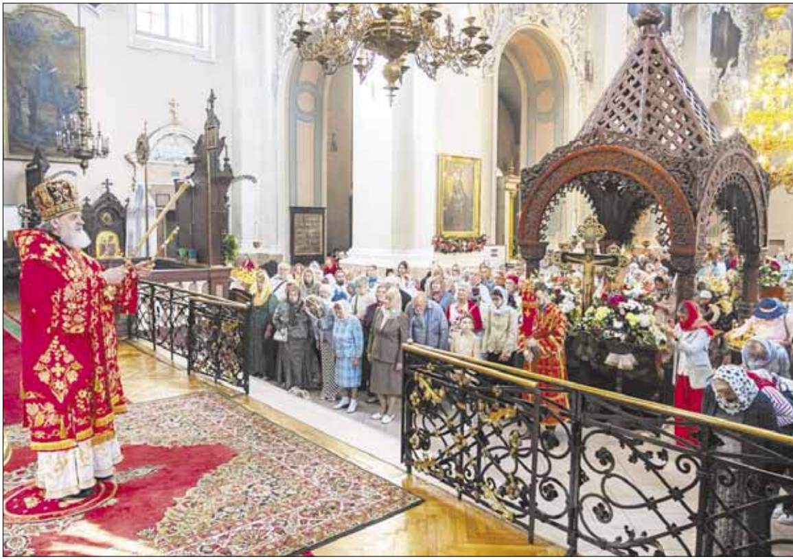
► Количество прихожан в храмах Литовской Православной Церкви в последнее время увеличилось, в том числе за счет украинских беженцев.

В конце апреля, в день памяти святых Виленских мучеников прошел большой крестный ход за единство Церкви, в котором приняли участие все священнослужители Литовской Православной Церкви и около трех тысяч мирян из разных уголков Литвы. Тем самым верующие продемонстрировали свое единство и молитвенную поддержку Матери-Церкви в трудное для нее время.