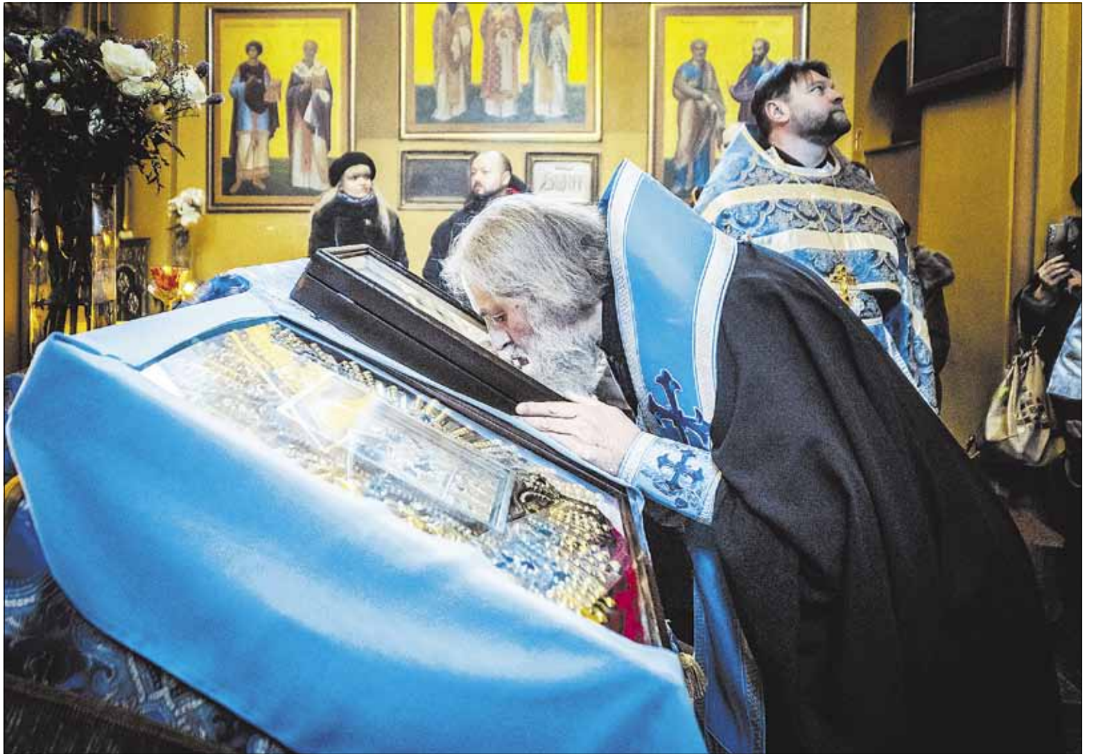
▶ Митрополит Иннокентий помолился в Пятницкой церкви г. Вильнюса с украинской православной общиной.

Он напомнил, что православные беженцы из Украины присоединились ко многим приходом Литовской Православной Церкви, где им оказывается под-