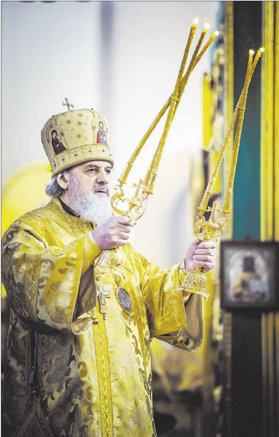
▶ Митрополит Виленский и Литовский Иннокентий.

Если мы со всяким смирением, вспоминая свои бесчисленные грехи, непрестанно повторяем эти важнейшие слова, говоря: «Боже, милостив буди ко мне грешному», то непременно открывается страшная правда о