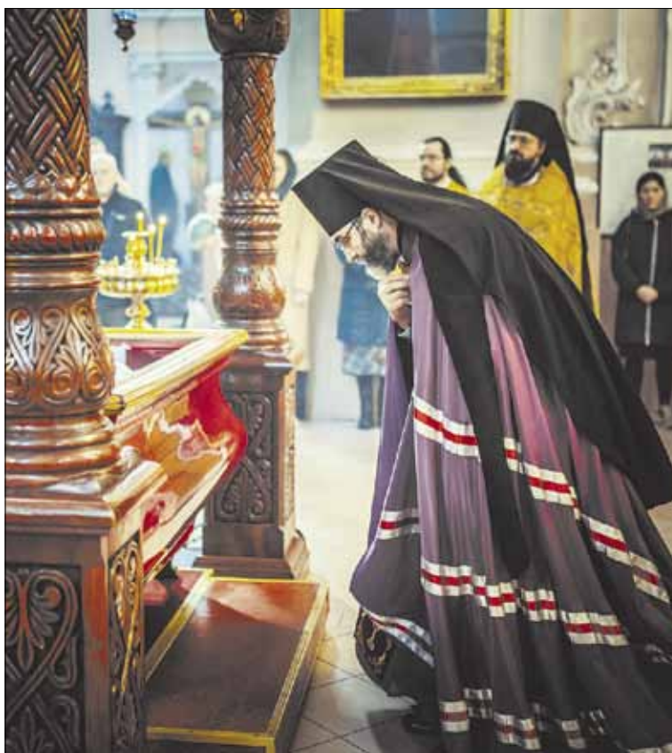
► Архиепископ Иаков помолился у раки с мощами святых Виленских мучеников.

— С этим трудно бороться, но мы стараемся. В школах у нас преподается Закон Божий. Католики идут на свои занятия, православные на свои. Но есть тенденция — молодежь не особенно ценит, что есть такие уроки в школе, и многие перестают их посещать. Мы стараемся заниматься молодежью в приходах, в каждом приходе проходят молодежные встречи. Летом мы так-