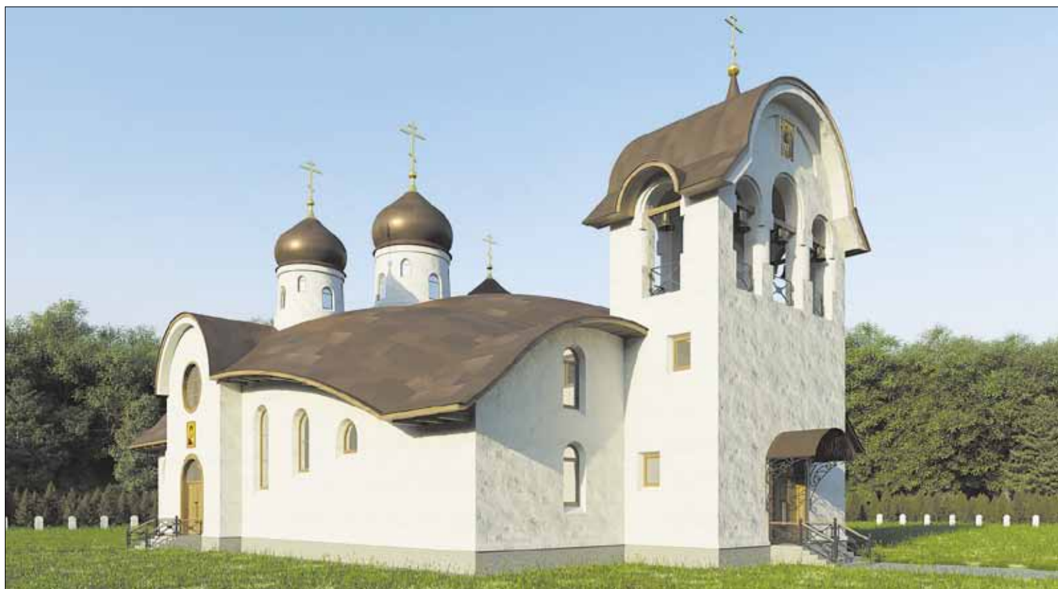
► Эскизный проект: новый михновский храм будет построен правее часовни на возвышенности за новым кладбищем

В Михновской православной общине начата подготовка к строительству нового Свято-Троицкого храма. Начат сбор пожертвований.