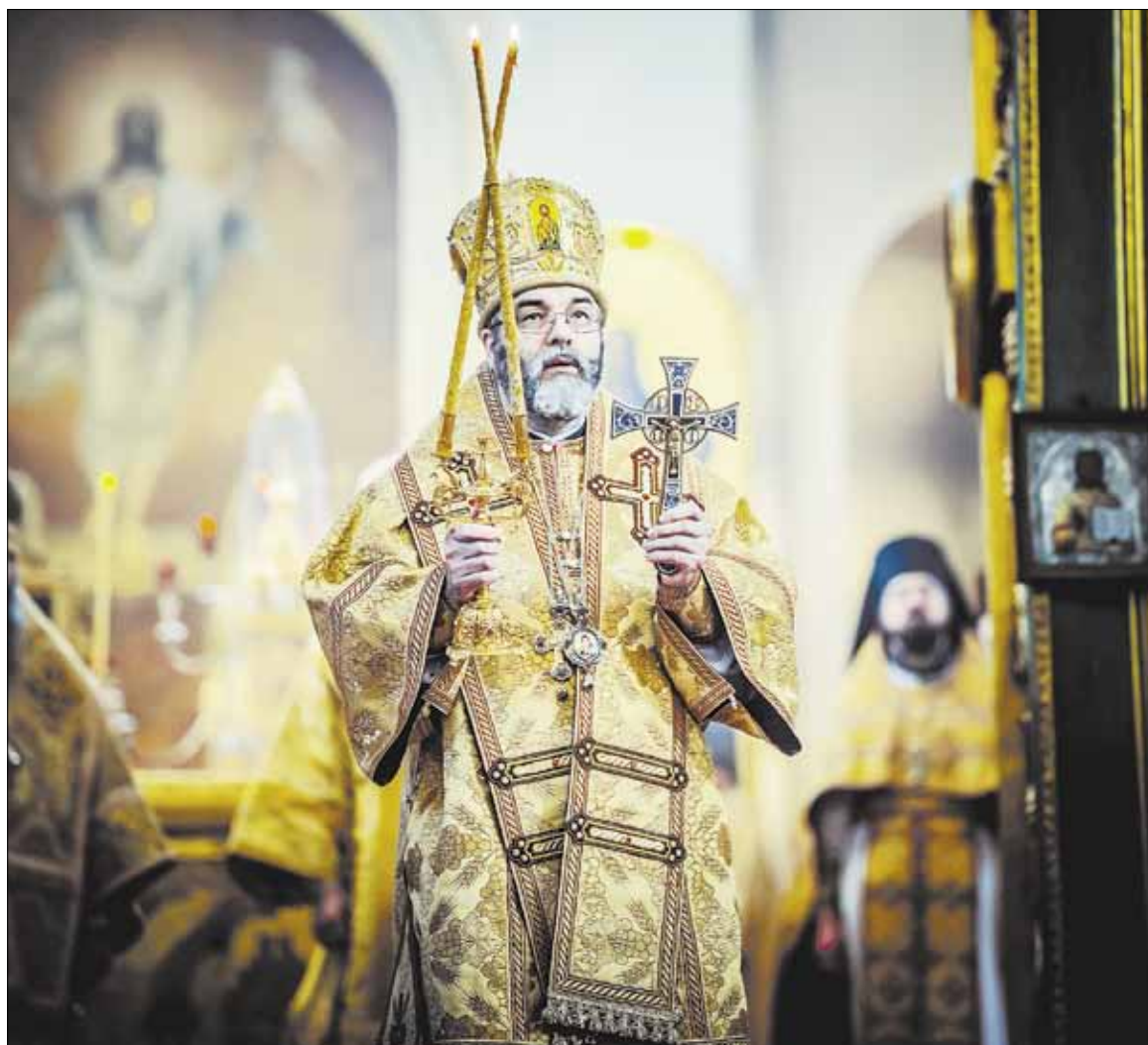
► Высокопреосвященнейший Иаков, архиепископ Белостокский и Гданьский, посетил Вильнюс с двухдневным визитом по приглашению митрополита Виленского и Литовского Иннокентия.

— Территория нашей епархии очень большая — расстояние от города Белосток до города Гданьск примерно равно расстоянию между Белостоком и Вильнюсом. В Белостоке боль-