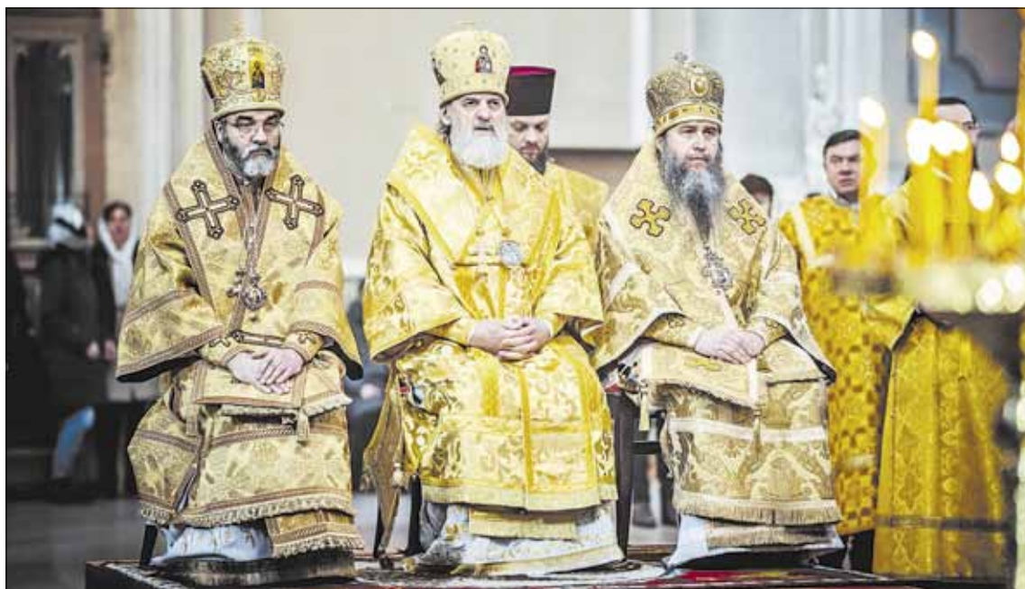
► Архиепископ Иаков сослужил в Свято-Духовом монастыре митрополиту Виленскому и Литовскому Иннокентию.

За богослужением пел архиерейский хор соборного храма