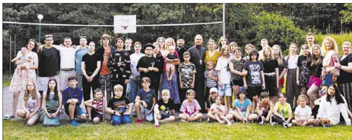
► Многие воспитанники воскресных школ имели летом возможность отдохнуть в православных лагерях

В течение лета дети из православных семей имели возможность отдохнуть в лагерях отдыха, организованных Православным братством Литвы.