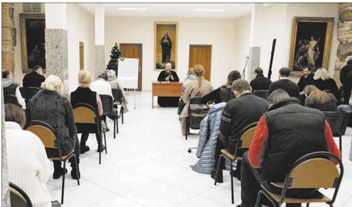
► Совсем скоро, в октябре 2024 года, возобновятся занятия на Богословских курсах

В этом контексте важно понять, что требуется человеку для успешного изучения богословских дисциплин.