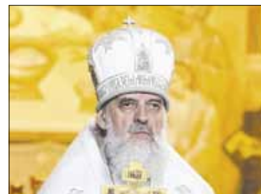
Митрополит Иннокентий о духовной жизни