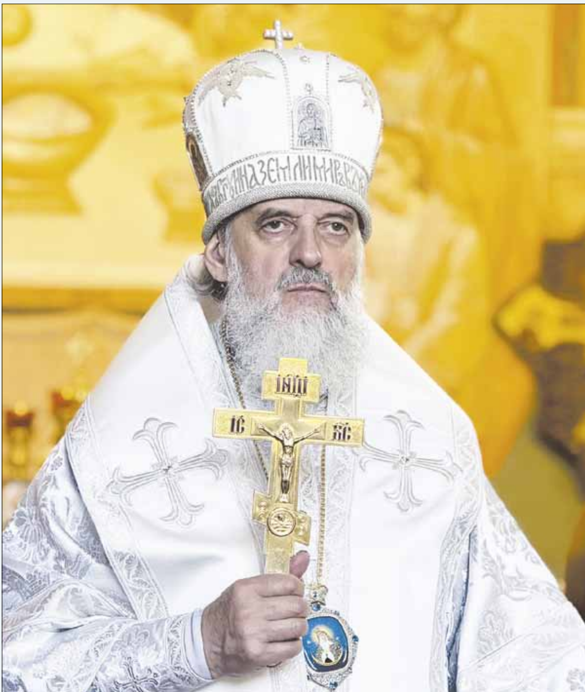
► Преосвященнейший Иннокентий, митрополит Виленский и Литовский.

Духовная жизнь есть новая жизнь уверовавшего в Иисуса Христа человека, порождаемая Божественной благодатью Святого Духа при согласии свободной человеческой воли. Начало полноценной духовной жизни полагается в таинстве Крещения, где человеку обильно подается благодать для духовного возрождения. В таинстве Крещения в христианине закладывается благодатное семя духовной жизни, развить которое зависит как от Бога, так и от произволения человека. Духовная жизнь есть познание Бога, об-