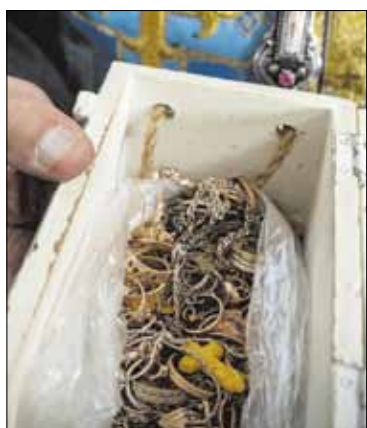
▶ В благодарность за совершенные чудеса верующие жертвуют образу Божией Матери золотые крестики, цепочки и перстни

По оценке экспертов рабочей группы, ошибка в описании закралась в связи с тем, что по преданию икона была привезена владыкой Ювеналием из места его предыдущего служения — Курска. К тому же в начале XX века не было общедоступных каталогов икон и разбигающихся в различных иконографических нюансах людей было немного.