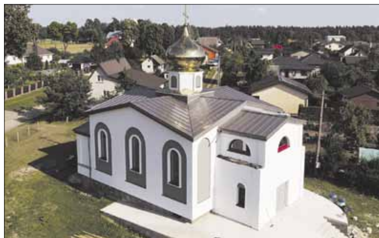
► Новый храм в Шальчининкай начинает приобретать законченный вид

Продолжается строительство Свято-Тихоновского храма в Шальчининкай.