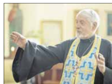
Возвращение чудотворной Знаменской иконы