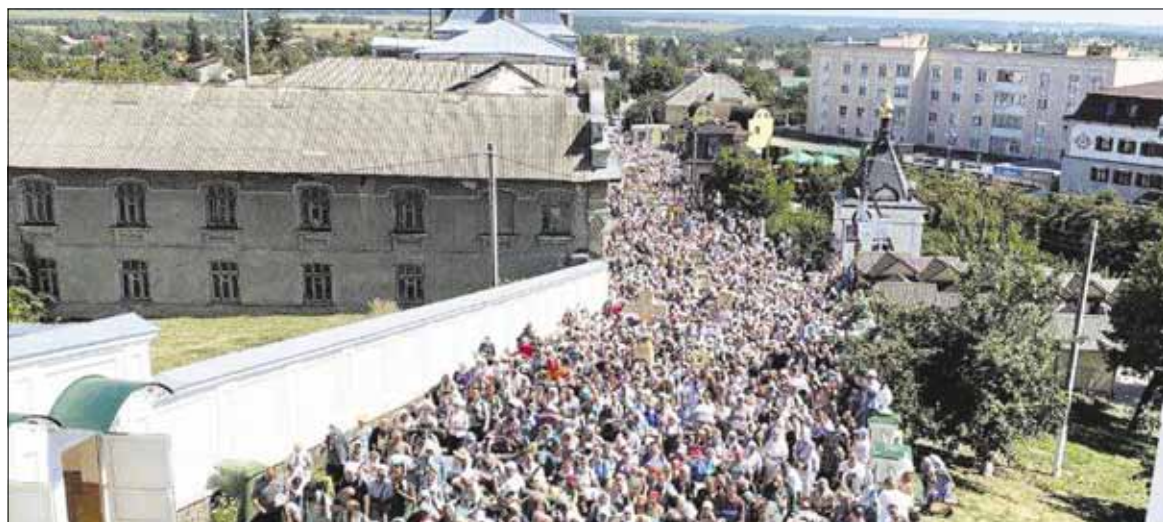
▶ На снимке: традиционный крестный ход верующих УПЦ в Почаевскую Лавру был многолюдным и в нынешнем году

Митрополит Виленский и Литовский Иннокентий распорядился, чтобы во всех храмах Литовской Православной Церкви ежедневно возносилась особая молитва о гонимой Украинской Православной Церкви (УПЦ), председателем которой является Блаженнейший Митрополит Онуфрий.