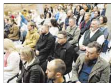
Нужны ли верующим богословские знания?