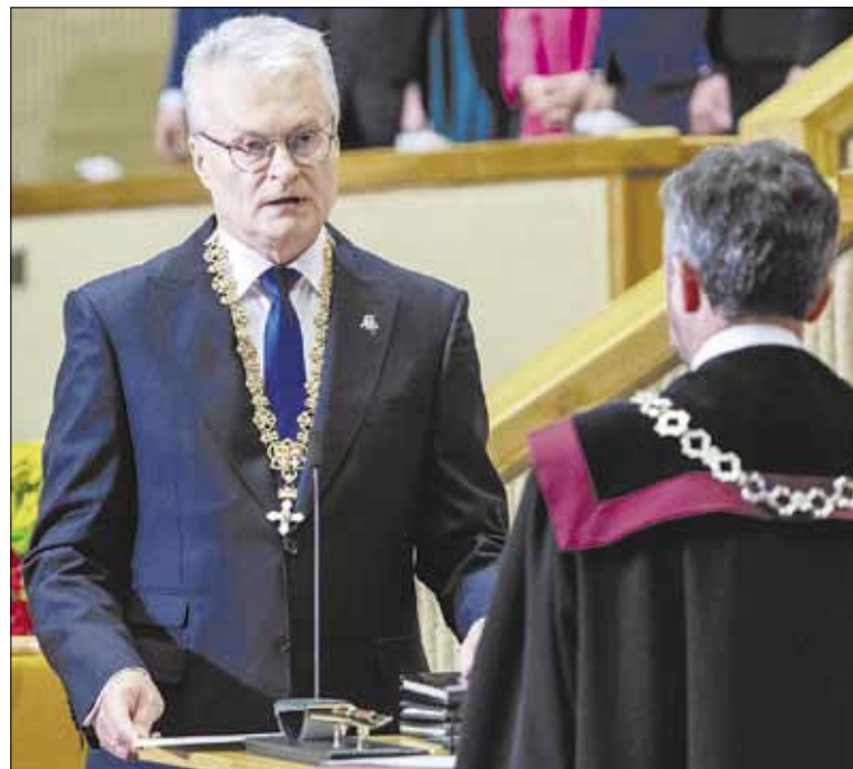
▶ Вторая по численности религиозная община Литвы не была представлена на церемонии инаугурации Президента