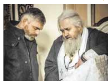
Ответы священника на вопросы прихожан