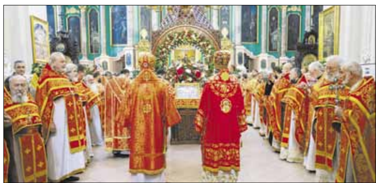
► На соборном богослужении в Свято-Духовом монастыре собрались все клирики Литовской Православной Церкви.

26 июля 2024 года в Свято-Духовом монастыре г. Вильнюса состоялись торжества в честь празднуемого в этот день дня памяти всех Литовских святых.