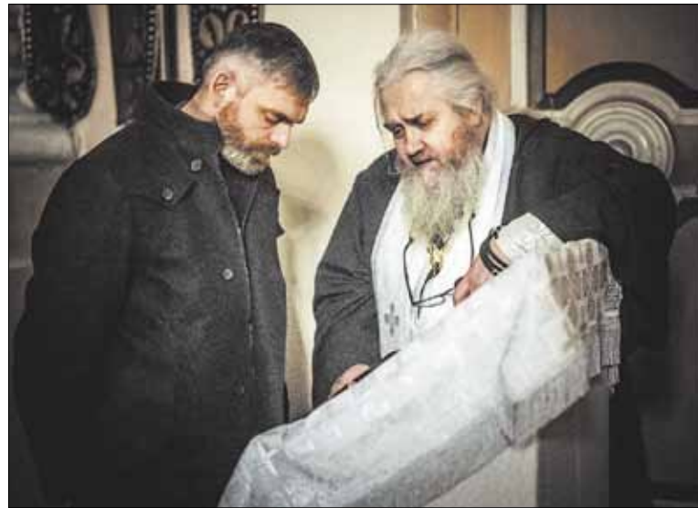
► Священнослужители предупреждают об опасности формализации исповеди.

33) Большинство святых отцов говорят, что хула на Святого Духа — это сознательное приписывание действий Духа Святого дьяволу. Кроме того, такая хула — это прямое неверие, безбожие, неверие в прощение (преп. Максим Исповедник). Также упорство в ереси, в расколе, в том, что наносит вред Церкви, как Телу Христову — это хула на Духа Святого (св. Игнатий Брянчанинов). Важной общей чертой этих объяснений является упорство в грехе и нераскаянность. Прощение зависит от самого человека. Господь неизменяем, потому Его милосердие и любовь неизменны. Потому благодать Его прощения и исцеления человека могут изливаться на человека неизменно. Вопрос в том, сможет ли человек воспринять Божию благодать, если в нераскаянном упорстве горделиво про-