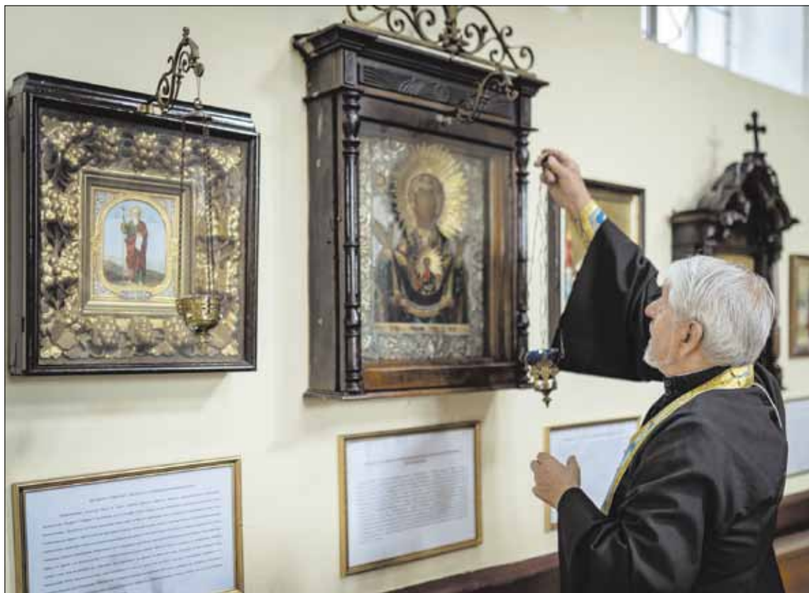
▶ Вновь обретенная чудотворная икона находится в левом приделе Знаменского храма г. Вильнюса

Вскоре после своего назначения настоятелем храма в конце