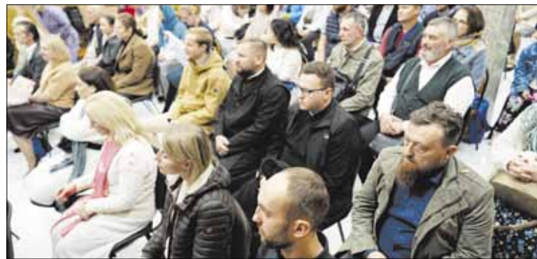
▶ Перешедшие на второй курс учащиеся Богословских курсов готовятся приступить к учебе

В начале октября 2024 года возобновятся занятия на Богословских курсах, открытых по благословию митрополита Виленского и Литовского Иннокентия год назад. К занятиям приступят порядка 60 человек из всех уголков Литвы – от Клайпеды, Мажейкяй и Таураге до Каунаса, Вильнюса и Висагинаса.