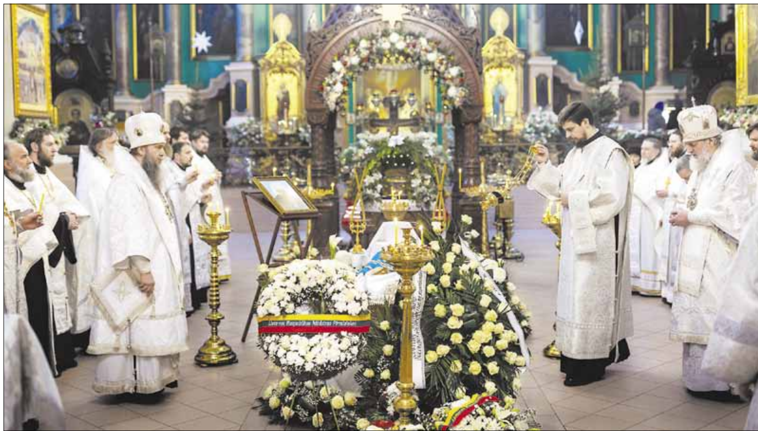
▶ Отпевание митрополита Хризостома прошло 8 января в соборном храме Свято-Духова монастыря

В пятницу, 14 февраля, на сороковой день после кончины митрополита Хризостома, в храмах Литовской Православной Церкви будут молиться об упокоении души легендарного архипастыря.