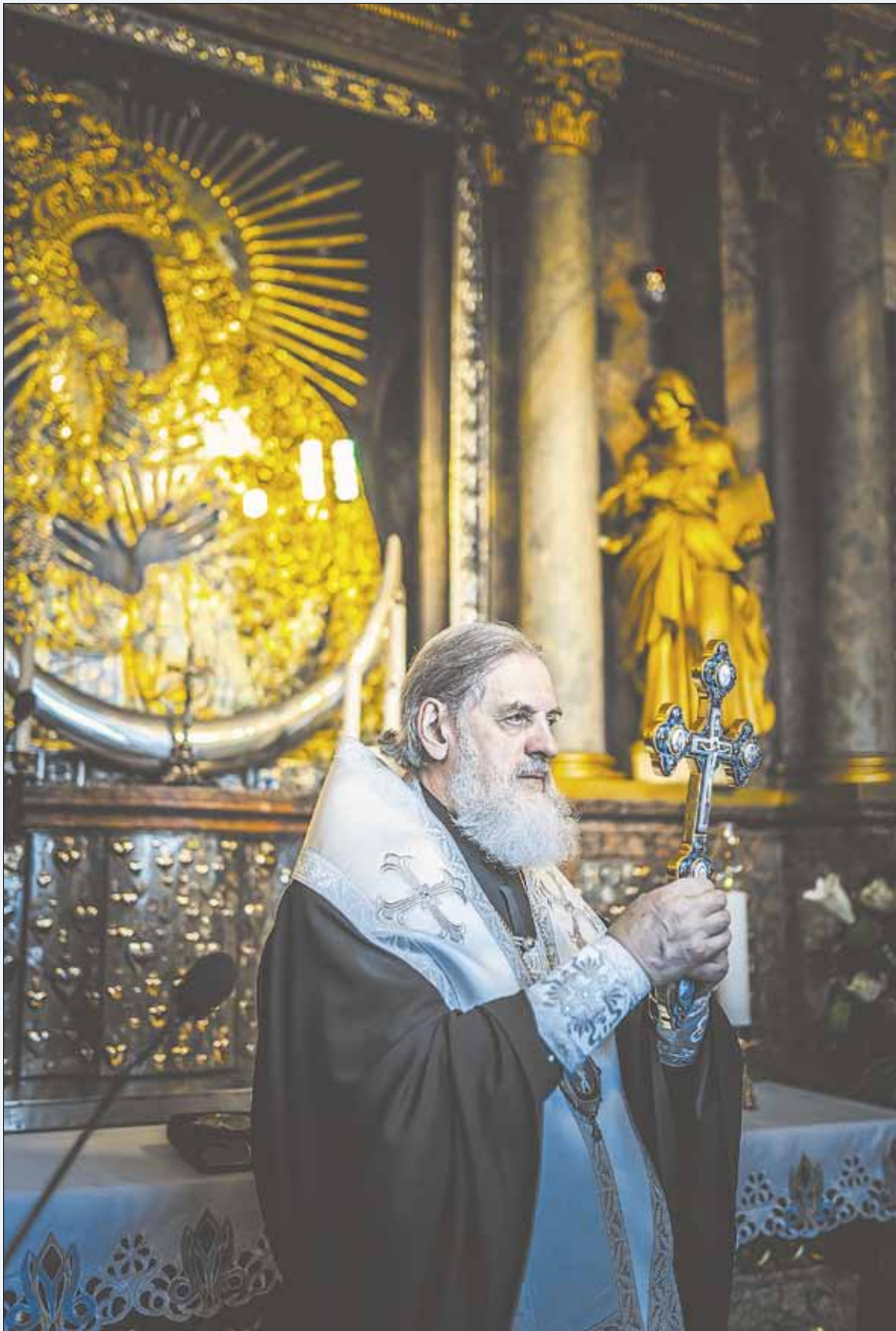
► Высокопреосвященнейший Иннокентий, митрополит Виленский и Литовский в Остробрамской часовне у чудотворного образа Божией Матери.

Великий пост — это время для духовного самоочищения, когда следует избегать конфликтов и споров. «Уклонись от зла и сотвори благо» (1Пет. 3:11), — эти слова Священного Писания должно в первую очередь помнить всем нам на протяжении всего Великого поста. К сожалению, даже среди людей церковных встречаются люди, не понимающие высокого духовного смысла Великого поста, считающие для себя достаточным и исчерпывающим простое воздержание от вкушения запретной пищи. Увы нам, неразумным, и горе нам — лицемерным! Внемли себе, человек, не употребляющий мяса: не огорчил ли ты