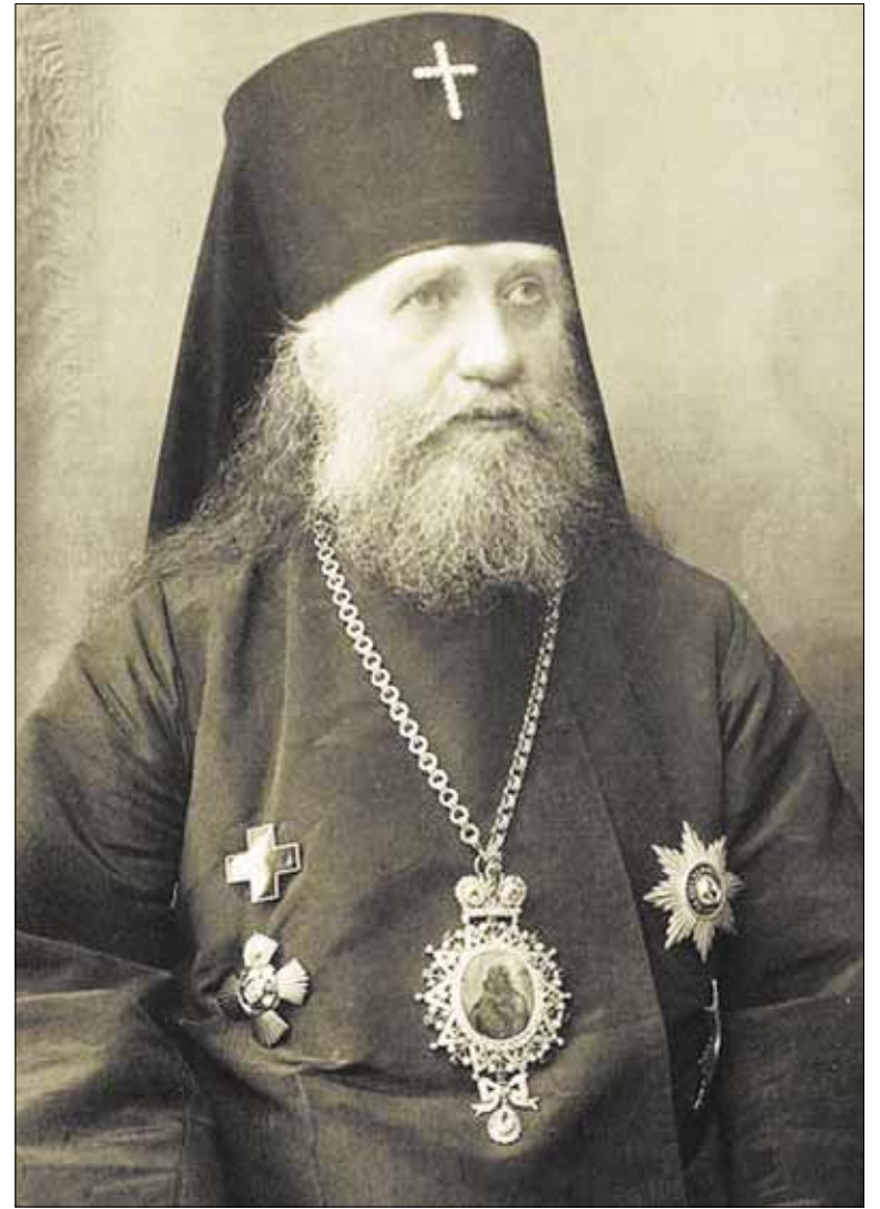
► Святитель Тихон в бытность архиепископом Виленским и Литовским

9 октября будет отмечаться прославление патриарха Тихона. На следующий день, 10 октября, в конференц-зале Свято-Духова