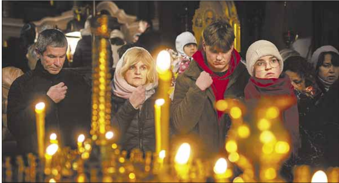
► Икона помогает сосредоточиться на молитве, она также рассказывает нам о святости духовного мира