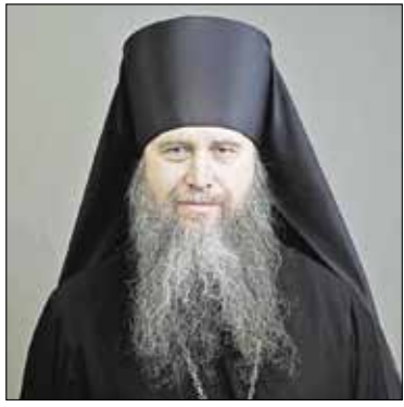
Епископ Тракайский АМБРОСИЙ