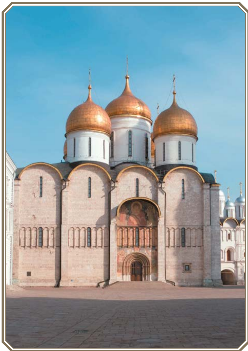
УСПЕНСКИЙ ПАТРИАРШИЙ СОБОР МОСКОВСКОГО КРЕМЛЯ